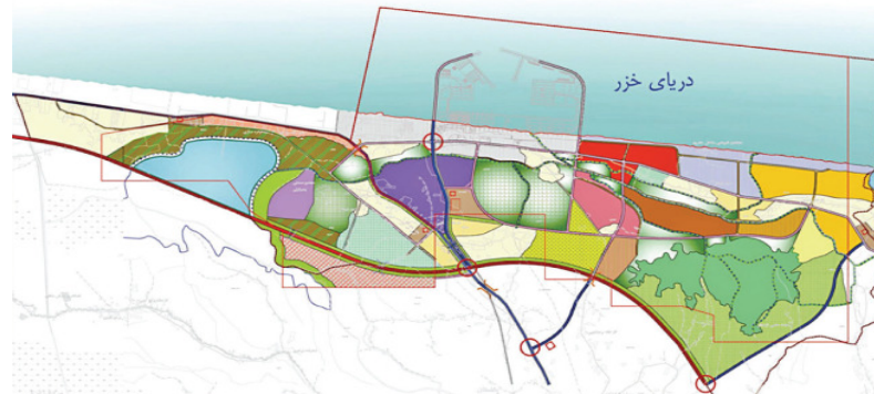
شکل ۱. موقعیت مکانی منطقه آزاد انزلی بر روی نقشه

۳۷ درجه و ۲۷ دقیقه عرض شمالی از خط استوا و ۴۹ درجه و ۳۳ دقیقه تا ۴۹ درجه و ۴۴ دقیقه طول شرقی از مبدأ نصف النهار گرینویچ قرار گرفته است که موقعیت مکانی آن در شکل ۱ نمایش داده شده است.