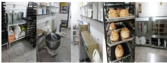
شکل ۱- فرآیند تولید محصولات قنادی الف: مواد اولیه ب: دستگاه مخلوط کن ج: دستگاه پهن کن د و ه: آماده سازی جهت عرضه به بازار