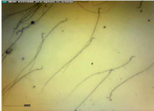
شکل شماره ۱. اسپرم طبیعی رت (درشت نمایی ۱۰×۱۰)