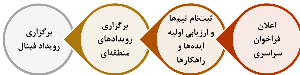
شکل ۲: فرآیند برگزاری لیگ اینترنت اشیا ایران

فینال راه خواهند یافت و در نهایت سه تیم برگزیده این دوره رقابت‌های لیگ در روز برگزاری مسابقه فینال مشخص خواهند شد. تیم‌های برگزیده علاوه بر دریافت جوایز نقدی، بسته به سطح و توانمندی تیم در انجام پروژه یا ورود به بازار و یا شتابدهی تسهیلات ویژه دریافت خواهند کرد. همچنین در حین برگزاری رویداد فینال و به فراخور سطح شرکت‌کنندگان امکان برگزاری دوره‌های آموزشی مهارت‌های نرم و کسب و کار برای شرکت‌کنندگان وجود دارد. با توجه به همکاری نزدیک مرکز نوآوری اینترنت اشیا با پارک‌های علم و فناوری مستقر در استان‌های مختلف کشور، رویدادهای منطقه‌ای با محوریت پارک‌های معین در مناطق مرتبط برگزار گردد.