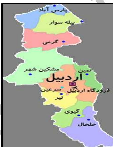
نقشه ۳. سطوح توسعه‌یافتگی استان اردبیل