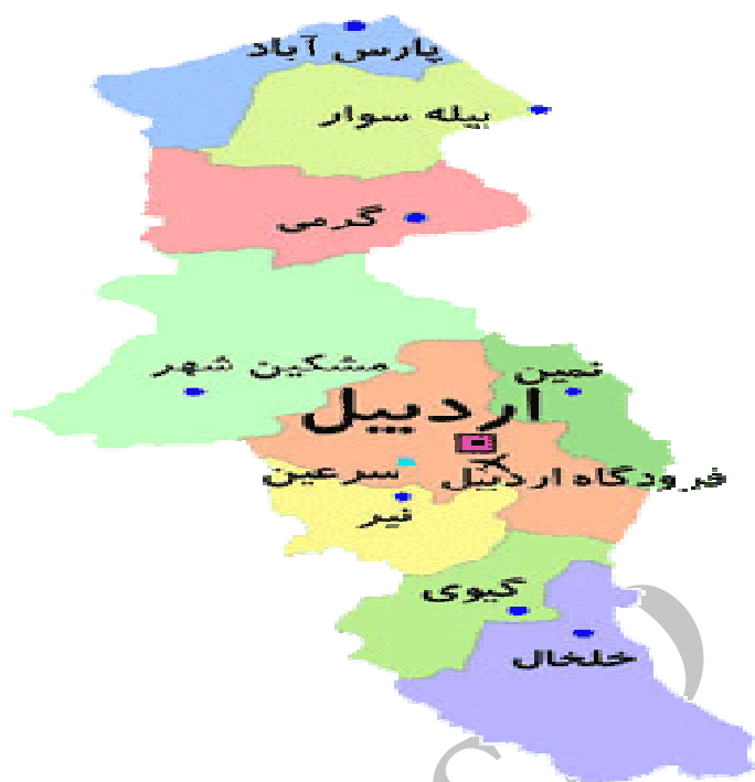
نقشه ۱. پراکنده‌گی جغرافیای شهرستانهای استان اردبیل