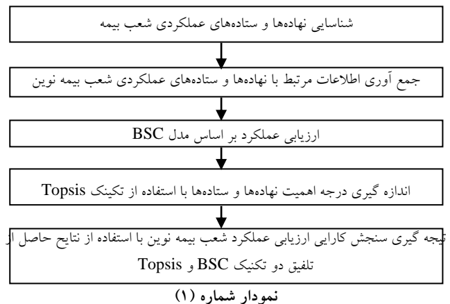
نمودار شماره (۱)

مطالعه موردی، شعب بیمه نوین می باشند که چهار شعبه به دلیل در دسترس بودن اطلاعات و در مناطق صنعتی قرار داشتن به عنوان نمونه برگزیده شدند. قلمرو موضوعی تحقیق مباحث مرتبط با بیمه و ارزیابی عملکرد می باشد. همچنین متغیرهای تحقیق با توجه به الگوی BSC شامل متغیرهای اصلی (مالی، مشتری، فرآیندهای داخلی و رشد و یادگیری) و در هر معیار ۳ معیار فرعی برگزیده شدند [۶]. معیارها بعد از انتخاب با نظر ۳ نفر از خبرگان صنعت بیمه از نظر روایی تطبیق داده شد. (نمودار شماره ۲)