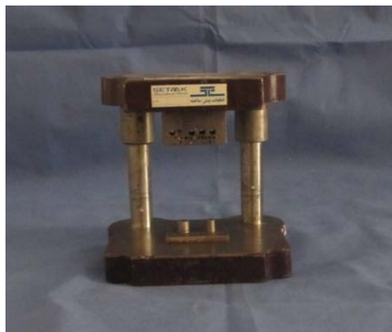
شکل ۱. مدل فلزی دو قسمتی

از جنس فولاد CK (نوعی فولاد ضد زنگ و مقاوم به سایش) و تقریباً مشابه با طرح صوری [۳۴] استفاده شد. این وسیله از دو قسمت تشکیل شده است (شکل ۱). قسمت اول شامل یک صفحه فولادی با دو دای به شکل مخروط ناقص با مقطع گرد و شش درجه تقارب می‌باشد.