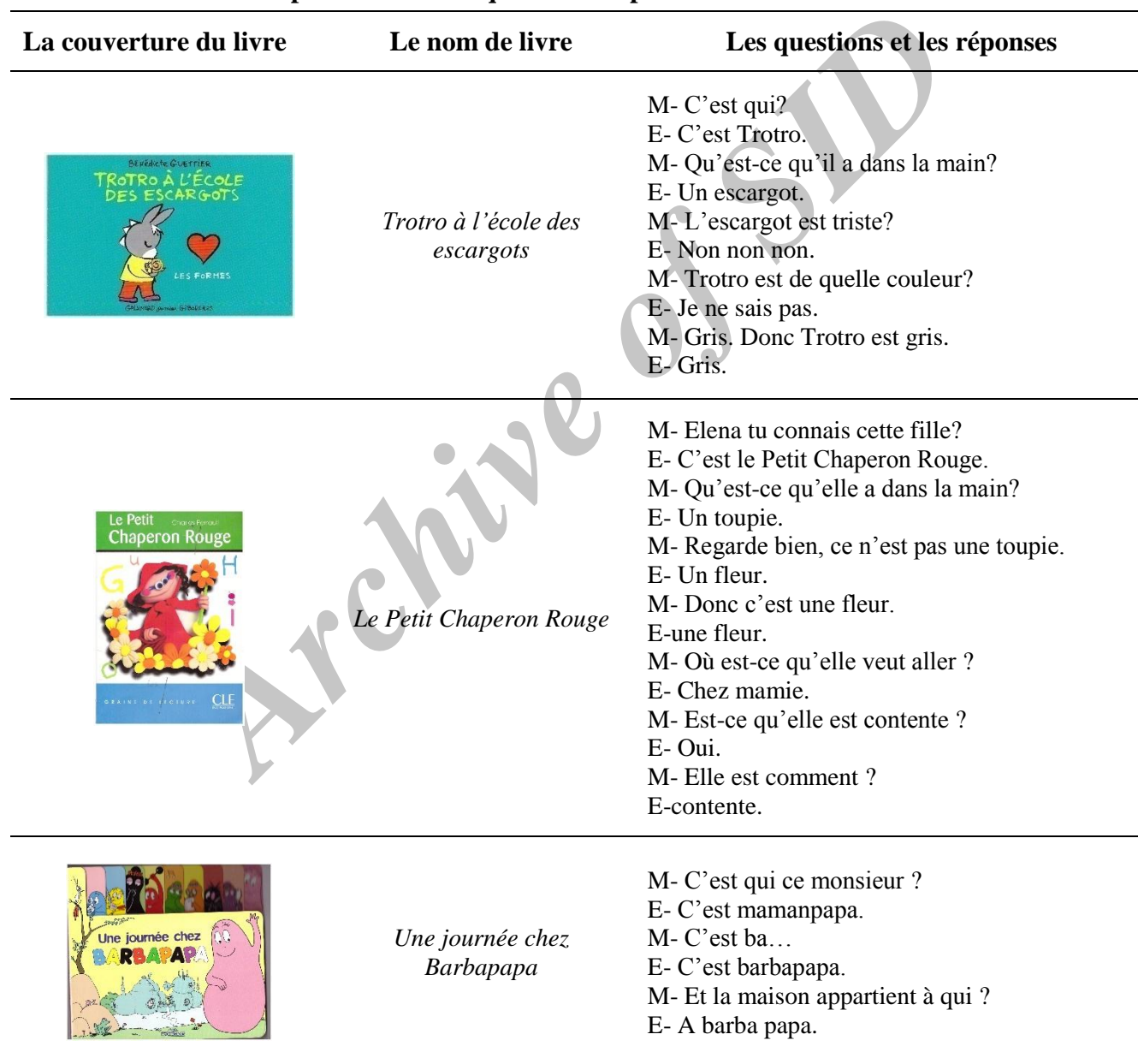
Tableau 3. Les exemples des séances questions/ réponses autour de la couverture des livres

Une séance de la lecture dialogique démarre principalement avec des conversations autour de la couverture du livre d'histoire. Et voici les exemples dérivés de nos séances d'enregistrements.