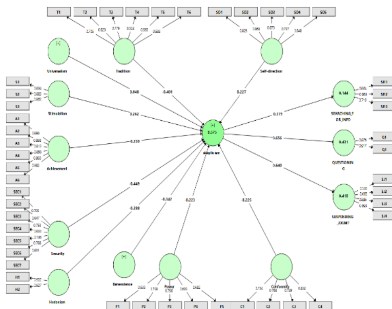
شکل ۲: مدل تردید حرفه‌ای حسابرس و ارزش‌های انسانی در حالت ضرایب استاندارد

با توجه به زیاد بودن تعداد متغیرها و گویه‌های مرتبط با هر یک از آن‌ها نتایج در قالب دو مدل ارائه گردید. همچنان که در بالا اشاره شد برای بررسی این فرضیه، نتایج در دو حالت