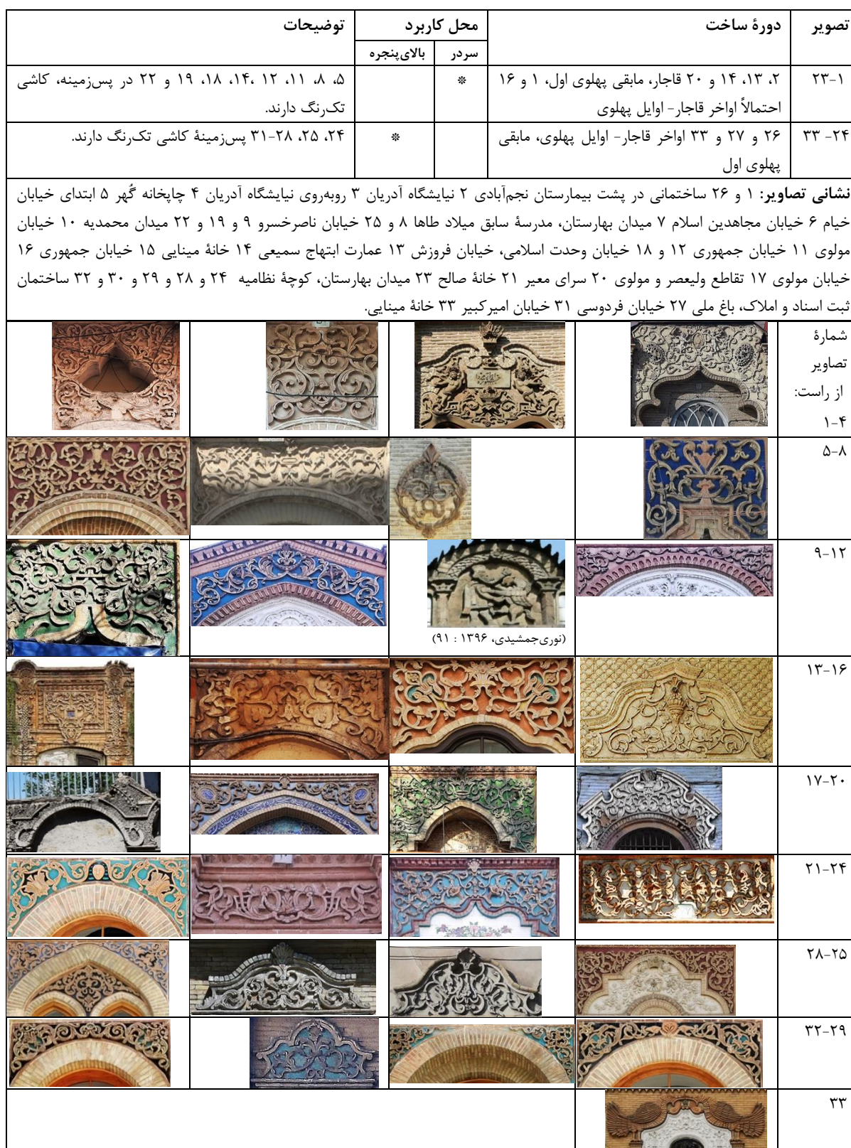
جدول ۸. سردر و بالای پنجره‌های منفرد (یگانه) در بناهای قاجار و پهلوی تهران (نگارندگان، ۱۳۹۹).