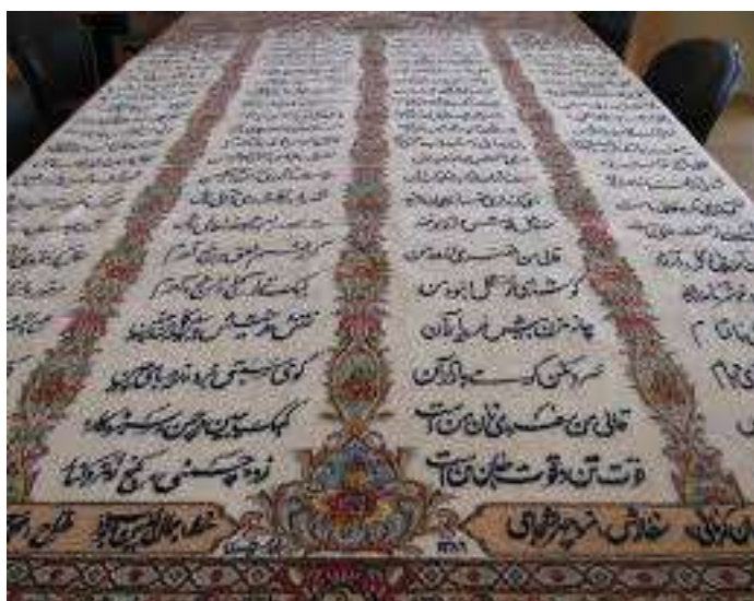
تصویر شماره ۳ تصویر قالی کرمان با طرح شعر پارسی