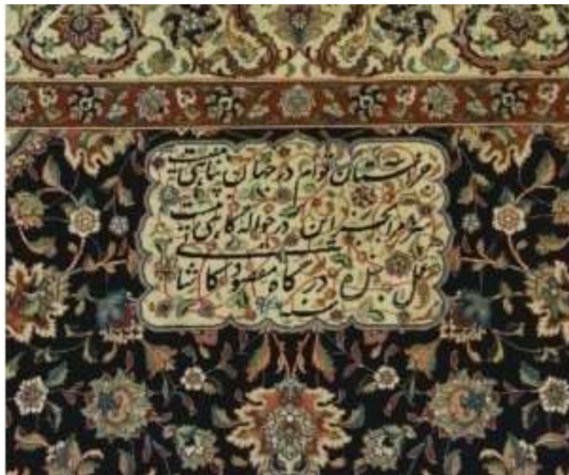
تصویر شماره ۲ تصویر قالی کاشان با طرح شعر پارسی

می توان ادعا کرد که قافیه در این شعر مولانا به دلخواه یا به اجبار نیامده است و جزء صورت شعر نیست، بلکه از سیرت آن مایه و نشأت می‌گیرد، فخامت غزل ایجاب کرده است که مولانا غزل را به قافیه آ/منتهی کند.