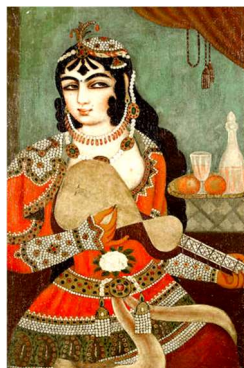
تصویر ۷. زن نوازنده، رنگ روغن روی بوم، ۵۳ در ۸۰، ۱۸۱۶م، احتمالاً ابوالقاسم ۲