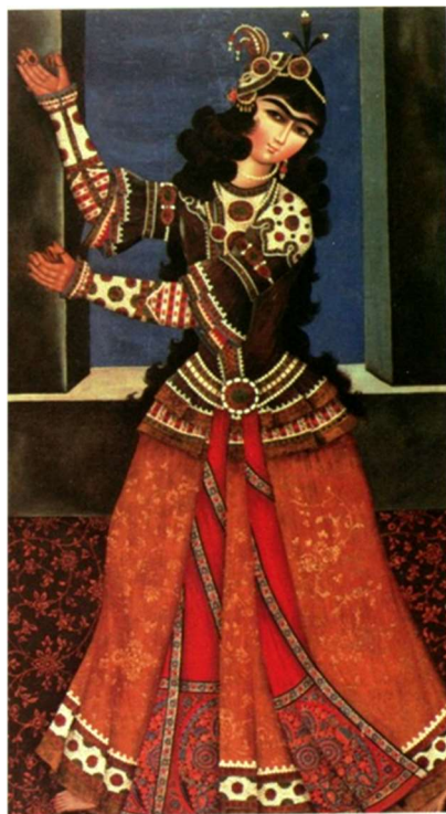
تصویر ۱. زن رقصنده با قاشقک موسیقی، هنرمند ناشناخته، ایران، اوایل قرن ۱۹، رنگ و روغن روی بوم، ۹۰ × ۱۵۸ سانتی متر، موزه ارمیتاژ، سن پترزبورگ، به شماره IHO - VR. (دیبا، ۱۹۹۹: ۲۶۳)

«این تصویر یک نمونه زیبا از موضوع مورد علاقه از زنان در نقاشی درباری قاجار است. نمایش زنان رقصنده، نوازندگان و آکروبات بازان از موضوعات تزئینی این دوران است. به طور معمول در نقاشی‌های زیبای این دوره با موضوع زن‌ها که نه تاریخ و نه امضا مشخصی دارد، سبک لباس زنان در نقاشی‌ها یکی است و بارها توسط مسافران اروپایی و روسی و دیپلمات‌ها توصیف شده است. این نقاشی (تصویر ۱) متعلق به اوایل قرن نوزدهم میلادی است، علاوه بر این تصویر که از موزه ارمیتاژ قصر موزه گتچین ۱ ، چهار نقاشی دیگر نیز وجود دارد که همه آنها به دوره سلطنت فتحعلی شاه قاجار تعلق دارند و مانند بسیاری دیگر از بوم‌های قاجار زنان را در حال رقص با سازهای موسیقی نشان می‌دهند. این اثر یکی از مجموعه نقاشی‌هایی است که برای تزئینات داخلی کاخ‌ها استفاده می‌شده است. در نقاشی دیگری از این مجموعه دختران رقصنده و نوازنده در موزه فاین آرت تفلیس گرجستان به شماره ۸۵۷/ ۸۵۶ قرار دارند. صورت‌ها مشابه این بوم نقاشی تکرار شده و تاکید هنرمند بر این مشابهت تاکید شده است. زنان نمایش داده شده در مقابل یک پنجره باز با الگوی تیره و روشن نشان داده شده‌اند و بوم‌ها دارای یک سایز و قالب یکسان است» (دیبا، ۱۹۹۹: ۲۶۳). تصاویر ۳-۲ آکروبات بازان و رقاصان دربار قاجار را نشان می‌دهد که تعداد تصاویر قابل توجهی نقاشی از زنان ایرانی در دوره قاجار توسط نقاشان هستند.