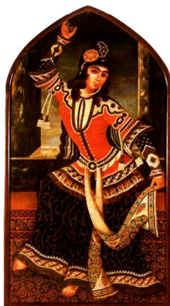
تصویر ۴. زن رقصنده قاجار، ۲۰×۹، موزه جورجیا (برتریت‌های قاجار، ۲۰۰۴: ۲۵)

این موارد نشان می‌دهد حرکت در نقاشی زنان بیشتر از سایر پیکرنگاری‌های این دوران بوده و حرکت در تصویر نقاشی دیده می‌شود و پیکری که در حال جنبش است و هنرمندان در ارائه نمایش حرکت موفق عمل کرده‌اند. در این میان نقاشی زنان رقصنده بیشتر از نوازندگان و آکروبات باز دارای حرکات اغراق آمیز است.