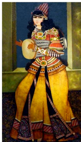
تصویر ۶. زن رقصنده قاجار با تنبک، هنرمند ناشناس، ۱۵۰×۸۵. رنگ و روغن، تهران (پرتیریت های قاجار، ۲۰۰۴: ۳)