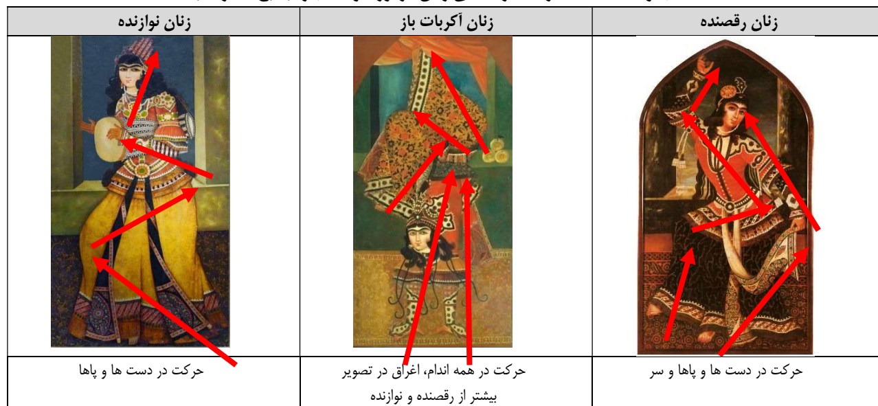
جدول ۱. مطالعه حرکت در نقاشی زنان در دوره اول قاجار.

این موارد نشان می‌دهد حرکت در نقاشی زنان بیشتر از سایر پیکرنگاری‌های این دوران بوده و حرکت در تصویر نقاشی دیده می‌شود و پیکری که در حال جنبش است و هنرمندان در ارائه نمایش حرکت موفق عمل کرده‌اند. در این میان نقاشی زنان رقصنده بیشتر از نوازندگان و آکروبات باز دارای حرکات اغراق آمیز است.