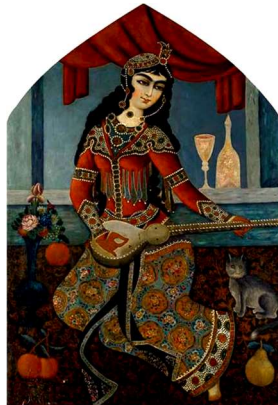
تصویر ۵. زن نوازنده قاجار، هنرمند ناشناس، تهران، قرن ۱۹ میلادی ۱

کارکرد زیبایی‌شناسی پیکرنگاری زنان رقصنده و نوازنده در نقاشی دوره اول قاجار ۳۱