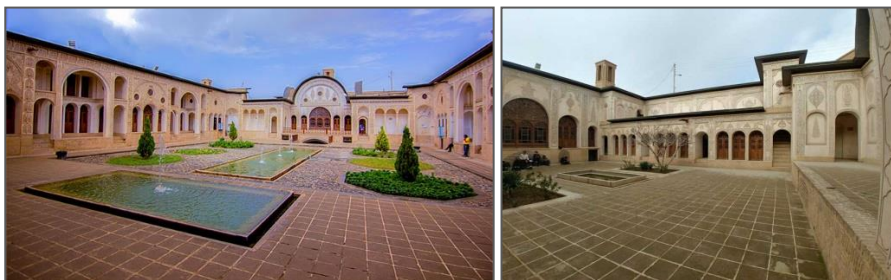
شکل ۱. خانه درون‌گرای ایرانی و اتاق‌هایی که همه رو به حیاط دارند؛ تصویر راست حیاط بیرونی و تصویر چپ حیاط اندرونی و در پایین پلان‌ها و تصویر سه‌بعدی خانه (خانه طباطبایی‌ها در کاشان)