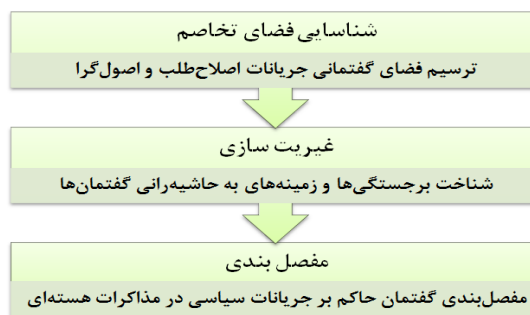
شکل ۲: مراحل تحلیل گفتمان لاکلاو و موف

در روش تحلیل گفتمانی لاکلاو و موف، گفتمان‌های مسلط دارای یک دال مرکزی بوده و دال‌ها و نشانه‌ها در شاکله‌ای به نام مفصل‌بندی، واجد ساختار و هویت شده‌اند. در این شرایط، رابطه از پیش تعیین‌شده و مشخص میان دال‌ها و مدلول‌ها وجود ندارد و دال‌ها یا نشانه‌ها دارای خصلتی شناور و سیال هستند؛ بر این اساس، مراحل تحلیل گفتمان به روش لاکلاو و موف را می‌توان بدین شکل ترسیم نمود: