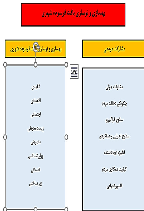
شکل ۲. مدل نهایی مشارکت مردمی و بهسازی و نوسازی بافت شهری

مشارکت جزئی نیز شامل ۳ شاخص تسکین بخشیدن، مشاوره، اطلاع‌رسانی است. از دیگر ابعاد مشارکت مردمی چگونگی دخالت مردم به صورت مستقیم و غیر مستقیم بوده است. اما در زمینه سطح فراگیری باید گفت این بعد شاخص‌هایی چون: محلی، منطقه‌ای و ملی را نشان می‌دهد که خود شامل سه بعد می‌شود. از سوی دیگر سطوح اجرایی و عملکردی نیز در بردارنده ۵ شاخص بهره‌مندی خدمات، ارزیابی خدمات، ارائه پیشنهاد، تصمیم‌گیری و برنامه‌ریزی، اجرا، نظارت است. علاوه بر این، ابعاد انگیزه ایجادکننده آن، کیفیت همکاری مردم، قلمرو اجرایی و موضوع خود شامل انگیزه درون‌زا، برون‌زا، همکاری طبیعی، خودانگیخته، داوطلبانه، برانگیخته، تحمیلی، اجباری و سیاسی، اقتصادی، اجتماعی است.