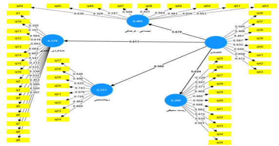
شکل ۱. ضرایب مسیر شاخص اقتصادی و بارهای عاملی گویه‌ها