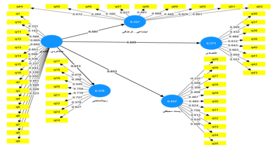
شکل ۳. ضرایب مسیر شاخص عملکردی - کالبدی و بارهای عاملی