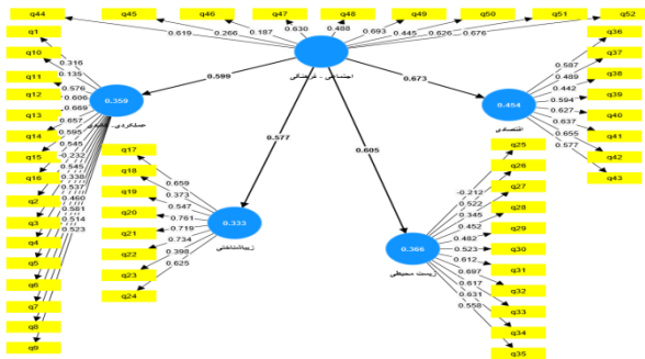
شکل ۲. ضرایب مسیر شاخص اجتماعی - فرهنگی و بارهای عاملی