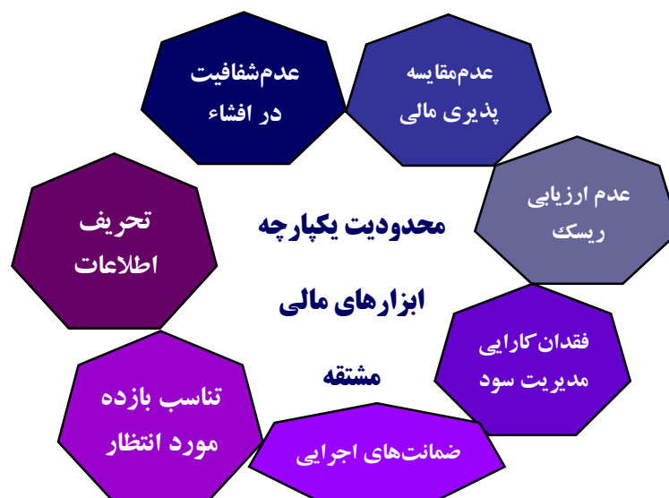
شکل ۳. چارچوب نظری پژوهش

نتایج پس از دو دور تحلیل دلفی نشان داد که تمامی مؤلفه‌های پژوهش براساس ضرب توافقی و میانگین مورد تأیید قرار گرفتند. براین اساس چارچوب نظری پژوهش در قالب شکل ۳ ارائه می‌شود.