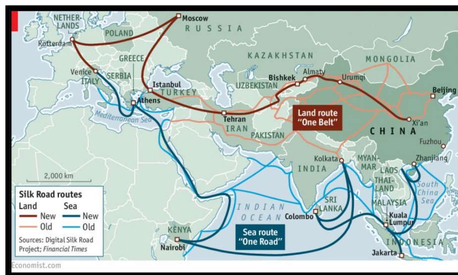
شکل (۳). ایران و کریدورهای بین‌المللی

ایران نگرانی‌های عمده‌ای در مورد جاه‌طلبی‌های ترانزیتی عراق و همکاری این کشور با چین دارد، از تضعیف احتمالی موقعیت خود در تجارت ترانزیتی گرفته تا اینکه بندر خرمشهر در نزدیکی ایران از موقعیت جغرافیایی مشابه فاو برخوردار نیست. همگی این مسائل انزوای بین‌المللی ایران و تأثیر تحریم‌ها بر این کشور را نشان می‌دهد (عزتی، هادی زاده، ۱۳۹۳: ۱-۱۲). پروژه بندر فاو فرصت‌های زیادی را برای عراق فراهم می‌کند تا نقش خود را در ترانزیت منطقه‌ای و موقعیت جغرافیایی خود را به طور گسترده تقویت کند. برای انجام این کار، ابتدا باید به چالش‌های داخلی مانند فساد و اختلافات سیاسی و چالش‌های خارجی مانند رقابت سرمایه‌گذاری بین چین و ایالات متحده بپردازد. با نگاهی به منطقه، به نظر می‌رسد پروژه‌هایی مانند فاو برای برخی از کشورها مانند ایران یک تهدید است، در حالی که احتمالاً به نفع برخی دیگر مانند ترکیه، قطر و سوریه است. علیرغم پتانسیل قابل توجهی که برای عراق وجود دارد، چه از نظر اقتصادی و چه از نظر سیاسی، غلبه بر چالش‌های مرتبط آسان نخواهد بود.