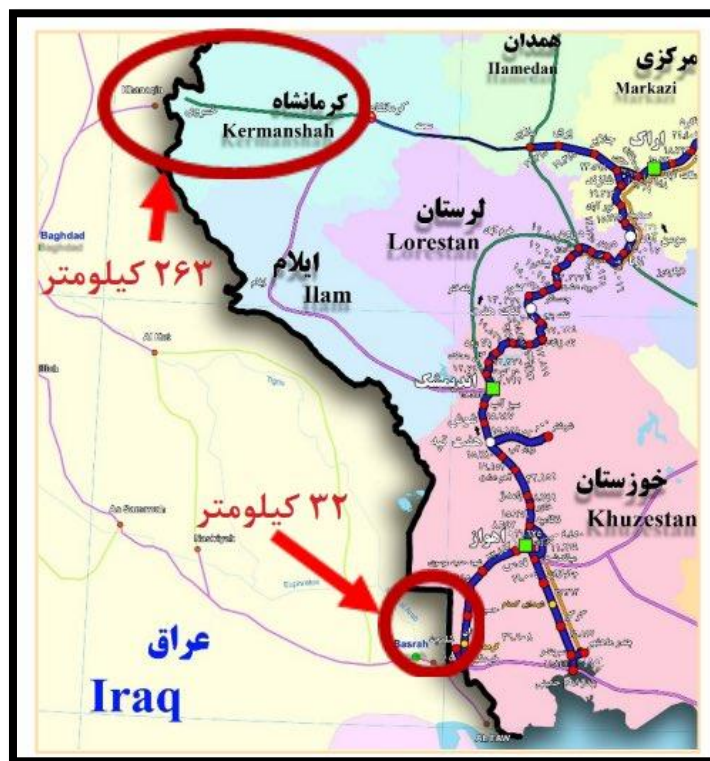
شکل ۶-مسیر ترانزیتی کرمانشاه _ بغداد

در عوض شلمچه_بصره، ایران می‌توانست راه آهن کرمانشاه_بغداد را از مسیر قصرشیرین-خانقین راه اندازد چراکه دسترسی به پایتخت در کشوری ازهم‌گسیخته امری است خردمندانه. همچنین، ایران می‌توانست با توسعه خط سنندج_سلیمانیه از مرز باشماق، دسترسی زمینی ایمن به بازار کردستان عراق داشته باشد شکل (۶).