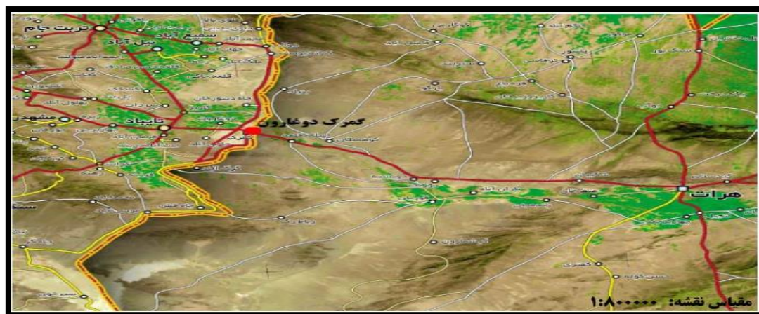
نقشه ۲: منطقه دوغارون واقع در مرز ایران و افغانستان

ب- استراتژی ایران در برابر احداث سد سلما توسط افغانستان: احداث سد سلما بر روی رودخانه فرامرزی هم در کشور افغانستان پیامدهای آبی، منطقه‌ای سیاسی، محیط زیستی و در کل هیدروپلیتیک حوضه آبریز را به دنبال خواهد داشت. ایران برای کاهش آسیب پذیری ناشی از احداث سد سلما چهار نوع استراتژی را پیش روی خود دارد: □ استراتژی اول: مبتنی بر تقویت روابط دیپلماتیک با