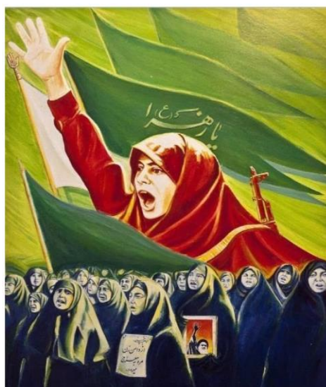
تصویر ۲. پوستر راهیان راه زینب. از محمد خزایی. ۱۳۶۲.

روحیه معنوی رزمندگان کشورمان، عامل مهمی در کسب پیروزی ایران در طول هشت سال دفاع مقدس به‌شمار می‌آید. اسلام ناب و ایمان به خدا بیشترین نقش و منافع اقتصادی کم‌ترین نقش را در شکل‌گیری روحیه مقاومت رزمندگان در دوران دفاع مقدس داشته است. تصویر شماره ۲، متن روی پرچم اوج ایمان و توکل به پروردگار را در میدان نبرد منعکس ساخته است.