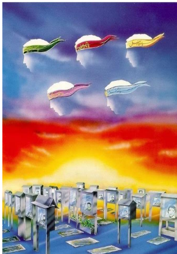
تصویر ۴. پوستر بهشت زهرا، از ابوالفضل عالی، ۱۳۶۲