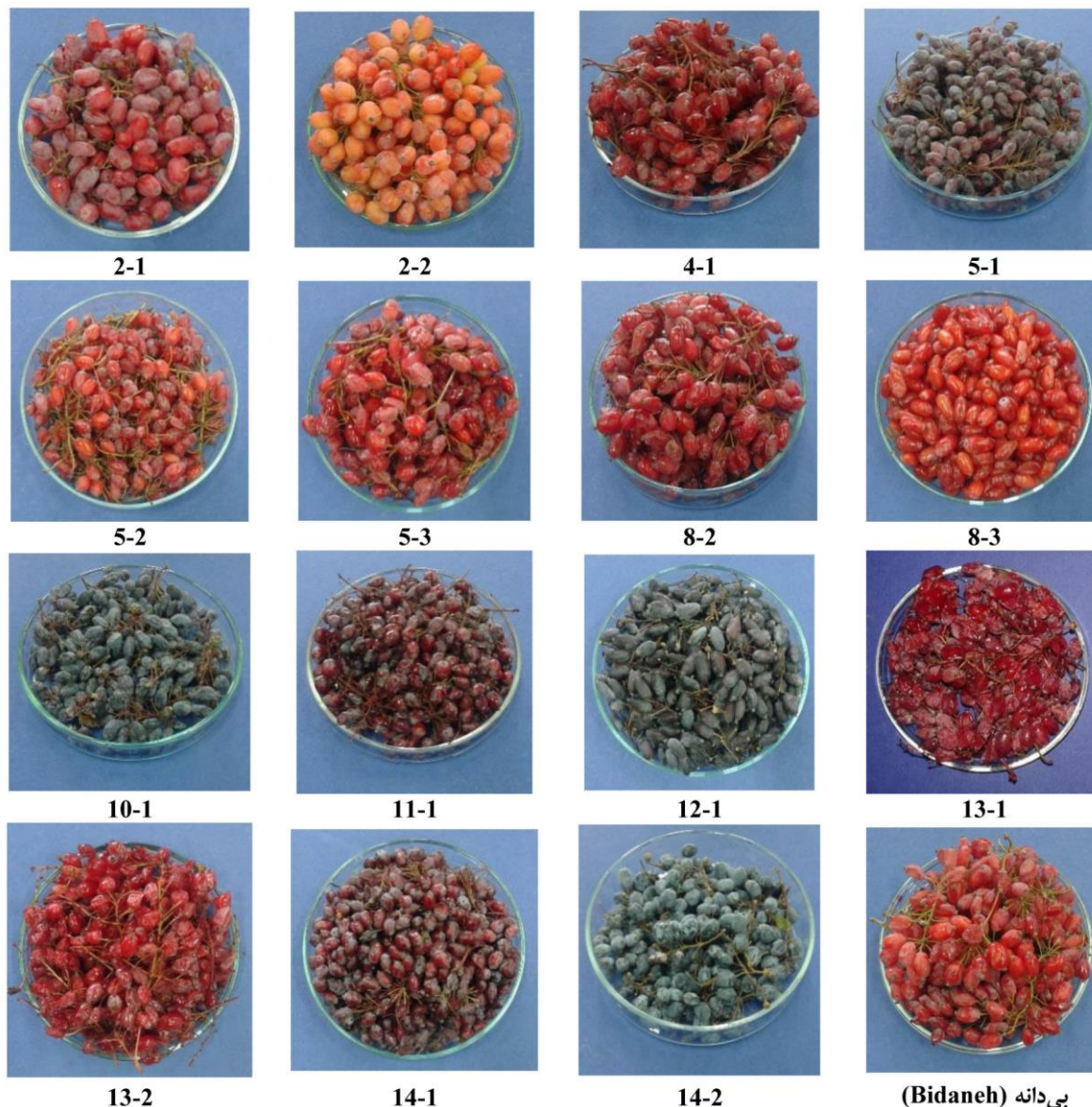
شکل ۱- تنوع رنگ میوه در شانزده ژنوتیپ زرشک مورد بررسی

(کدهای اشاره شده، کدهای هرباریومی ثبت شده در موسسه پژوهشی علوم و صنایع غذایی مشهد می‌باشند.)