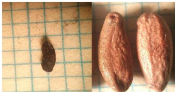
شکل ۳- بذور سالم (سمت راست) و بذور سقط‌شده (سمت چپ) در یکی از ژنوتیپ‌های زرشک مورد بررسی Figure 3- Set seeds (right) and aborted seed (left) in one of the evaluated barberry genotypes

اندازه‌گیری غیر مستقیم آن صفت استفاده کرد (Zarei et al., 2010). در این پژوهش ضرایب همبستگی بین ۱۵ صفت در ژنوتیپ‌های مورد مطالعه اندازه‌گیری شده که در جدول ۵ آورده شده است. ضرایب همبستگی ساده بین صفات نشان می‌دهد که بین برخی از صفات اندازه‌گیری شده همبستگی معنی‌داری وجود دارد. برای مثال درصد گوشت با درصد بذور همبستگی منفی بسیار معنی‌داری در سطح ۱ درصد دارد. بنابراین با کاهش تعداد بذور و به بیان دیگر با توسعه پارتوکاری در زرشک می‌توان انتظار داشت که درصد گوشت میوه‌ها افزایش یافته و کیفیت میوه بهبود یابد.