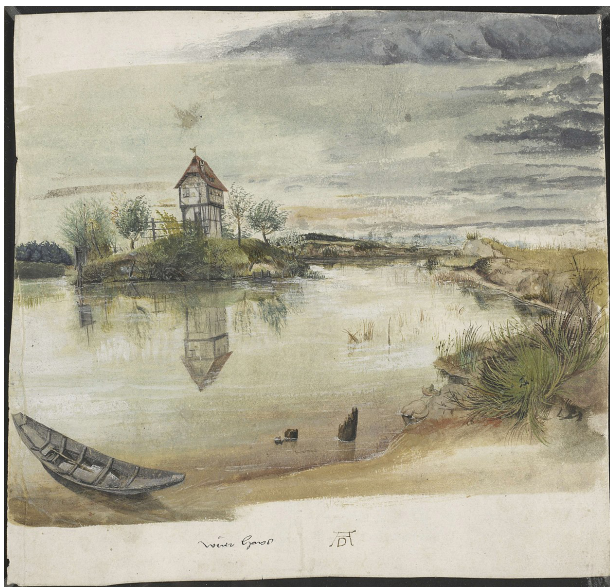
تصویر ۷- دور: خانه‌ای در کنار برکه (۱۴۹۶ م.).