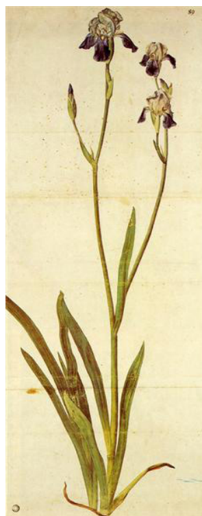
تصویر ۱- دورر: گل زنبق (۱۵۰۳ م.).

می‌گرفته است اما این موضوع فرصتی جدید را پیش روی هنرمند قرار داد تا از بند ظاهر محسوس کمی جدا شود و درک خود را وارد موضوع کند. در واقع اگر در بازنمایی کرگدن رویکردی ناتورالیستی اتخاذ شده است ولی همچنان احساس و برداشت شخصی هنرمند از آن در حین اجرا نقشی غیرقابل انکار داشته است. در قطعه‌ای بزرگ از گیاهان چمنی (تصویر ۴) البته با نگاه متفاوتی از هنرمند روبه‌رو هستیم. هنرمند در این اثر چندین عنصر طبیعت را در کنار هم تصویر می‌کند. نکته‌ای که حائز اهمیت است این است که گویی هنرمند در پرداخت به هر یک از این عناصر به صورت جداگانه، کاستی در آن حس کرده است و همین حس به این برداشت منجر می‌شود که در پرداخت به طبیعت گاهی نمی‌توان عناصر را از هم تفکیک کرد. آن‌ها در کنار هم هستند که تظاهر می‌کنند و معنا می‌یابند. برگ‌ها، ساقه‌ها و گل‌های گیاهان مختلف بر روی زمینی خیس و تر گواهی از اتصال و یکپارچگی در طبیعت هستند.