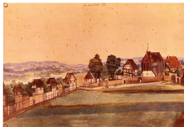
تصویر ۵- دور: کلیسای یوحنا‌ی قدیس (۱۴۸۹ م.).

در منظره برکه‌ای در جنگل درختان کاج طراحی کاملاً ابتدایی و ساده دارند. همچنین ساختار ترکیب‌بندی با گذشت زمان پویاتر و چشم‌نوازتر شده است. ترکیب‌بندی در دو اثری که از لحاظ زمانی مقدم‌تر هستند، نمایی از کلیسای یوحنا‌ی قدیس و کارگاه فلزکاری، کم‌تحرک و در مورد اول تقریباً ایستا است. در ادامه او با طرح تکنیک لایه‌گذاری در آبرنگ، عمق را به تصاویرش افزود و نشان داد که قدرتی خاص در کنترل تکنیک آبرنگ دارد. با وجود این تکنیک‌ها، در منظره‌پردازی‌ها با آزادی در نگاه و دست هنرمند روبه‌رو می‌شویم. هنرمندی که اینجا از قالب فرم‌ها رها می‌شود تا از وجه دیگری به طبیعت بنگرد. وجهی که مفهوم زندگی، مرگ و چرخه‌ی جهان را پیش روی مخاطب قرار می‌دهد. تضاد میان عناصر طبیعت، درختان زنده و مرده، آسمان پرتلاطم و خروشان و آرامش و سکون آب، ساختارهای فرمی متفاوت، رنگ‌های مکمل و متضاد و کنتراست‌های شدید نور، بیش از یک مطالعه صرف از طبیعت به درک هنرمند از جهان و طبیعتی فانی و ناپایدار اشاره می‌کند. از طرفی دیگر در منظره‌پردازی‌ها با مدرنیته‌ای خاص روبه‌رو می‌شویم چنانچه اگر آن‌ها را از ظرف زمانی خویش خارج کنیم، گویی هنرمندی مدرنیست در قرن ۱۹ میلادی چنین آثاری را خلق کرده است. آثاری که بر عینیت‌گرایی هنرمند صحنه گذاشته و گستره‌ی توانمندی هنرمند را به رخ می‌کشد. عناصر رنگ، نور و تاش‌های ایجادشده توسط قلم‌مو (جدای از ترکیب‌بندی که همواره در آثار دورر شاخص هستند)، ابزار مهم هنرمند در این عینیت‌گرایی است. درست است اکثریت آثار دورر به چاپ‌هایش مربوط می‌شود و از بعضی