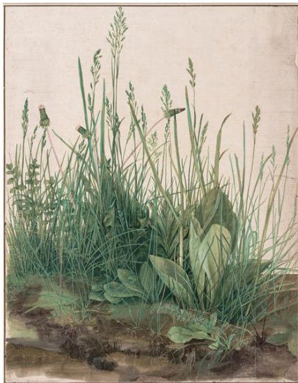
تصویر ۴- دورر: قطعه‌ای بزرگ از گیاهان چمنی (۱۵۰۳ م.).