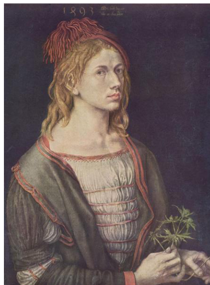
تصویر ۹- دورر: خودنگاره (پرتره هنرمند با گل خار در دستانش) (۱۴۹۳ م.).

آلمان بیشتر معطوف به انواع چاپ‌های فلز و چوب بود و هنرمند تجربه‌ای بسیار کم در استفاده صحیح از رنگ و نور داشت. او با کنتراست‌های شدید تاریکی و روشنی که در زمینه و پس‌زمینه ایجاد می‌کند فیگورهایش را بیرون می‌کشد و فضای سه‌بعدی را بر روی بومش القا می‌کند. او برخلاف منظره‌پردازی‌هایش در رنگ‌روغن به نسبت، اندازه‌ها و هندسه‌ی تصویر اهمیت ویژه‌ای می‌دهد. فیگورهای او در کامل‌ترین تناسبات آناتومی طراحی شده‌اند. کفایت دوباره به دست‌های خودنگاره‌اش در سال ۱۴۹۳ میلادی توجه شود (تصویر ۹). فرم‌های کوچک مانند بند انگشتان با دقت و تناسب صحیح، بازنمایی درست و عینی از آنچه از ساختار دست می‌شناسیم را ارائه می‌دهد. حتی در دست‌های چهره‌ی فولگر جوان (تصویر ۱۰) درست است که دست‌ها با دست‌های طبیعی انسان کمی فاصله دارد ولی آنچه می‌بینیم دست انسان است که در اینجا ملتهب به نظر می‌رسد. شاید واقعاً دختر جوان از آرتریت ۲۴ یا یک بیماری التهاب