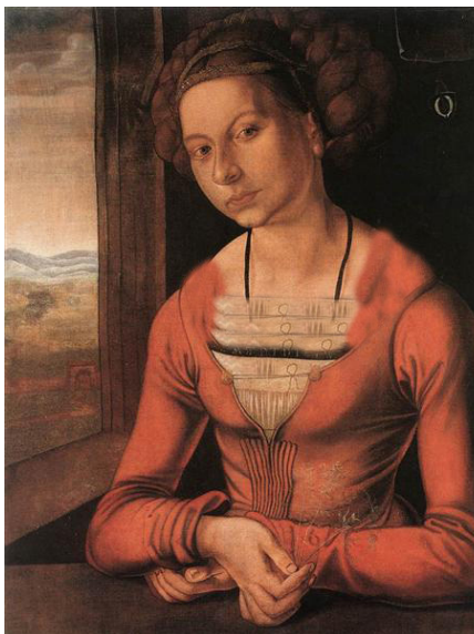
تصویر ۱۰- دورر: پرتره‌ی فولگر جوان (۱۴۹۷ م.).