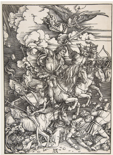
تصویر ۱۳- دورر: چهار اسب‌سوار آخرالزمان (۱۴۹۷-۱۴۹۸ م.).