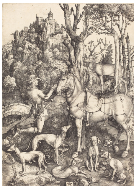
تصویر ۱۱- دورر: اوستاتیوس قدیس (۱۵۰۱ م.).

دورر آنچه را در مطالعاتش بر روی گیاهان و حیوانات در کارگاهش آموخته است در چاپ‌هایش به منظر ظهور می‌رساند. جزئیات آن چنان است که برای دریافتشان مدت‌ها می‌توان به نظاره نشست. در میان چاپ‌هایش نیز مطمئناً چاپ‌های گود بر روی فلز (مانند مس) به دلیل امکان ایجاد تونالیته‌های بیشتر به واقعیت نزدیک‌تر می‌شوند (تصاویر ۱۱-۱۲). درختان و ابرها نقش مهمی در ترکیب‌بندی‌ها ایفا می‌کنند. درختان با قامت کشیده و بلند مانند ستون در ساختمان تصویری عمل می‌کنند و حس پایداری، سکون و آرامش با حضور درختان و حیوانات به فضا القا می‌شود. ابرها نیز در ترکیب با فضای منفی پس‌زمینه به کمپوزیسیون تصویر قوت می‌بخشند. خطوط، هچینگ ۳۸ ‌های متقاطع و نقطه‌نگاری‌ها علاوه بر ایجاد تونالیته‌ها و ارزش‌های خاکستری در تصویر و بازنمایی جنس و بافت وظیفه‌ی دیگری نیز بر عهده دارند. خطوط تمایز ایجاد