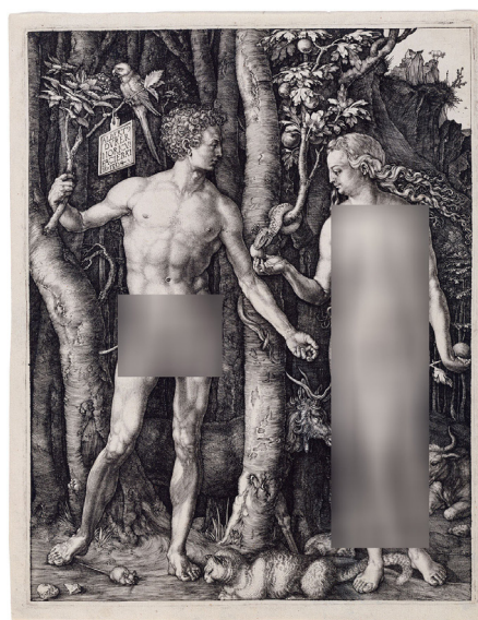
تصویر ۱۲- دورر: آدم و حوا (۱۵۰۴ م.).