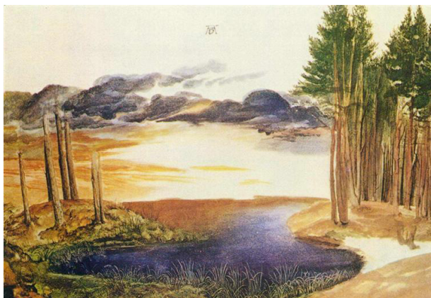
تصویر ۸- دور: منظره برکه‌ای در جنگل (۱۴۹۷ م.).

از منظرپردازی‌ها به‌منظور الگو در چاپ‌هایش بهره برده است، ولی تصویرسازی طبیعت و مناظر در سفرها، نقطه‌ی آرامشی را برای هنرمند ایجاد می‌کرد تا به دریافت طبیعت بنشیند، حقیقت و هدف زندگی را کند و کاش و آن را لمس کند.