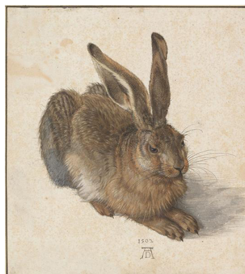
تصویر ۲- دورر: خرگوش برنا (۱۵۰۲ م.).