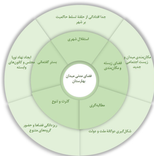
تصویر ۷. گزاره‌های مطرح در تحقق فضای مدنی میدان بهارستان و ایجاد انشقاق در نظم سنتی و مسلط بر فضای عمومی شهری.

جامعه بوده که قوت و ضعفش درگرو میزان رواج آزادی در بستر اجتماعی است. در یک بیان کلی شهر نوین ایرانی تنها در بازنمایی کالبدی، خیابان‌کشی جدید، عناصر کالبدی نظیر چراغ‌برق، تراموا اسبی، و... باز نمود پیدا نمی‌کند بلکه در نقطه گاهی تاریخی تغییر اجتماعی با تغییر کالبدی برخورد پیدا کرده و در این لحظه فضای مدنی متولد شده است. میدان بهارستان