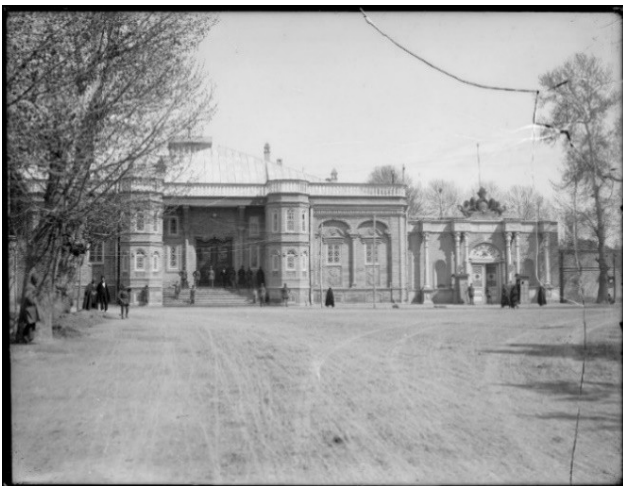
تصویر ۳. میدان بهارستان و عمارت مجلس شورای ملی در دوره قاجار.

زیر به‌عنوان نتایج حاصل از تحلیل اسناد و مطالعات صورت گرفته مبتنی بر منطق حاکم بر نگاه پژوهش گر مطرح شده و مورد بحث واقع می‌شوند.