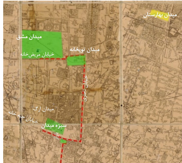
تصویر ۴. جدا افتادگی میدان بهارستان در نسبت با شبکه فضاهای عمومی تهران پس از توسعه ناصری در نقشه عبدالغفار.

تاریخ معاصر ایران همواره با پرسشی مهم مواجه است، چه وضعیتی پایگاه قدرت قاجاری را به فکر به توپ بستن مجلس می‌اندازد؟ برای درهم شکستن مقاومت مشروطه‌خواهان قدرت دست به تخریب کالبدی پایگاه ایشان می‌زند؛ به نظر می‌رسد استبداد در شرایطی جدید قرار گرفته است. فضایی که تا مدت کمی قبل از آن جزء مایملک حکومتی بود و میدانی که کارکردی تفرجگاهی داشت، به تصرف جبهه مقابل درآمده بود. لذا پس از کش‌وقوس‌های فراوان، حذف کالبدی راهکار استبداد برای خاموش کردن صدای مشروطه‌خواهان در میدان و فضاهای جانبی آن است. در اصل عمارت بهارستان و میدان جلوخان آن مانند سرزمینی از دست‌رفته می‌بایست، از دشمنان بازپس گرفته شود و لوحه سردر آن از جا کنده شود (عاقلی، ۱۳۷۴، ۵۴). البته که خوانش این مواجهه محمدعلی شاه قاجار و فرمانده قزاق وی «لیاخوف روسی» با مجموعه میدان بهارستان در همین نقطه به پایان نمی‌رسد. بررسی نحوه به توپ بستن شدن مجلس در ۲ تیر ۱۲۸۷ ش. بیانگر تلاش حکومت برای نابودی همه مظاهر مدنیت‌خواهی بود که برحسب رخدادهای چند سال پیش از آن در این میدان متمرکز شده بودند. آن‌گونه که در تصویر ۵ روشن می‌گردد استقرار توپ‌ها در مدخل چهار خیابان منتهی به میدان است. به عبارتی همه جداره‌های میدان که در آن لحظه تاریخی اکثراً محل قرارگیری انجمن‌ها و کانون‌های سیاسی-مدنی (رحمانیان، ۱۳۹۰، ۱۳۳) بودند، مورد هجوم توپ‌ها و نیروی نظامی قرار می‌گیرند و تخریب حداکثری بدل به سناریو استبداد برای مقابله با پروبلماتیک میدان می‌شود. همانند تجربه‌ای مشابه در دوره اخیر یعنی تخریب مجسمه مروراید میدان لولو (تصویر ۶) توسط دولت بحرین در ۸ مارس ۲۰۱۱،