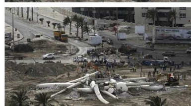
تصویر ۶. مجسمه مروراید میدان لؤلؤ شهر منامه بحرین که در جریان انقلاب‌های بهار عربی به نماد و نشانه مبارزه‌خواهی مردم بحرین توسط دولت در ۸ مارس ۲۰۱۱ تخریب می‌شود.