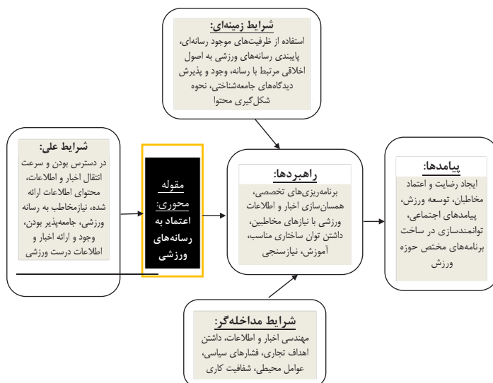
شکل ۱. مدل نهایی اعتماد مخاطبان به انواع رسانه‌های ورزشی Figure 1. The final model of audience trust in a variety of sports media

نتایج به دست آمده از تجزیه و تحلیل مصاحبه‌های کیفی نشان داد که پیامدهای حاصل از اعتماد مخاطبان به انواع رسانه‌های ورزشی از ۴ مقوله محوری و ۲۵ کد مستخرج از مصاحبه‌ها تشکیل شده است. در این مرحله، مقوله‌ها به صورت یک شبکه یکدیگر در ارتباط قرار می‌گیرند. همچنین این مرحله مشتمل بر ترسیم نموداری است که الگوی کدگذاری نامیده می‌شود. الگوی کدگذاری، روابط میان عوامل مؤثر بر ارزیابی عملکرد فدراسیون‌ها را نشان می‌دهد (کریوگر ۱ و نیومن ۲ ، ۲۰۰۶). این فرایند در نمودار ۱ نمایان است.