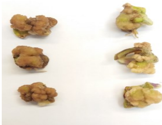
شکل ۱- مقایسه بین کالوس‌ها در محیط با و بدون وراپامیل؛ سمت راست: کالوس‌های حاصل از ریزنمونه‌های گوجه‌فرنگی تلقیح شده با Agrobacterium tumefaciens رشد کرده در محیط دارای وراپامیل، سمت چپ: کالوس‌های حاصل از ریزنمونه‌های گوجه‌فرنگی تلقیح شده با Agrobacterium tumefaciens رشد کرده در محیط فاقد وراپامیل

Figure 2- Comparison between calluses in mediums containing and free verapamil. Right: The calluses derived from inoculated tomato explants with Agrobacterium tumefaciens that grows in medium containing verapamil and Left: The calluses derived from inoculated tomato explants with Agrobacterium tumefaciens that grows in medium free verapamil.