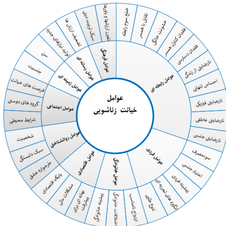
نمودار ۲. مدل مفهومی استخراج شده از «عوامل خیانت زناشویی» از یافته‌های پژوهش حاضر

یافته‌های پژوهش حاضر نشان داد که خیانت زناشویی، نه صرفاً ریشه‌های روان‌شناختی دارد و نه اجتماعی و نه حتی اقتصادی. به عبارتی خیانت، پدیده‌ای «تک عاملی» نیست بلکه مجموعه‌ای از عوامل مختلف، می‌تواند منجر به بروز خیانت زناشویی شوند. با این حال، برای بروز خیانت، الزاماً نیازی به حضور همه این عوامل در کنار یکدیگر نیست بلکه بخشی از این عوامل یا ترکیبی از آنها نیز می‌تواند خیانت زناشویی یا حداقل پتانسیل وقوع آن را پدید آورد. از طرفی، این یافته‌ها گویای آن بود که عوامل خیانت زناشویی، چنان زیاد است که تقریباً می‌توان پتانسیل خیانت را در بخش زیادی از خانواده‌ها جستجو نمود. در این راستا به نظر می‌رسد که نارضایتی جنسی و عاطفی، از مهمترین عوامل بروز خیانت زناشویی هستند؛ چرا که بیشترین تأکید در مطالعات پیشین در حوزه خیانت زناشویی بر این دو عامل تمرکز یافته است. با این حال نکته مهم آن است که اگرچه این دو عامل از بازیگران اصلی هستند اما تنها بازیگران