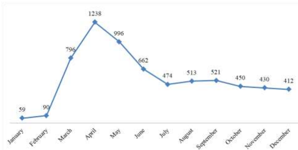
نمودار ۲. روند ماهانه طرح های تحقیقاتی مصوب کووید-۱۹ ایران در سال ۲۰۲۰