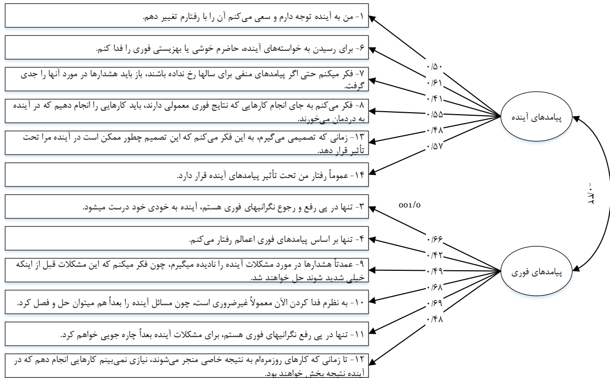
شکل ۱. بارهای عاملی سؤالات روی خرده مقیاس‌های پرسشنامه در نظر گرفتن پیامدهای آینده (تمام بارهای عاملی در سطح خطای ۱ درصد معنادارند)