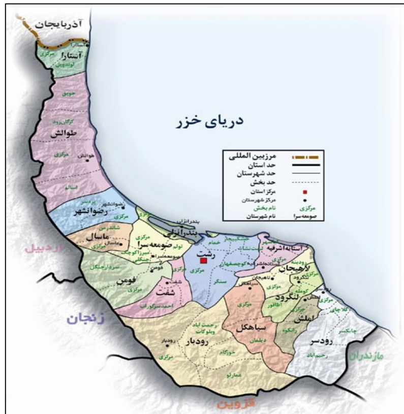
شکل ۱) موقعیت جغرافیایی و تقسیمات شهری استان گیلان. (منبع: سازمان میراث فرهنگی، صنایع دستی و گردشگری گیلان).