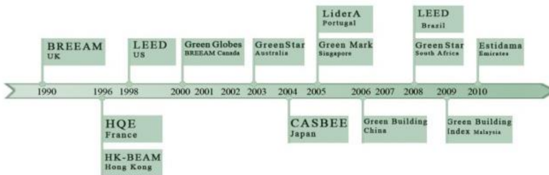
نمودار ۲. روند تدوین سیستم‌های امتیازدهی زیست محیطی ساختمان