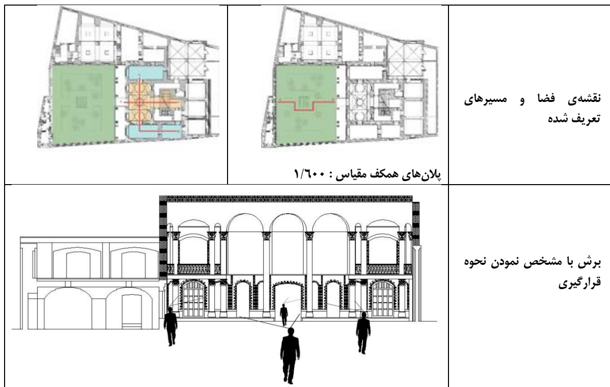
جدو 6-محورهای حرکتی تعریف شده و تصاویر دریافتی سوژه از اُبژه در مسیرهای تعریف شده.