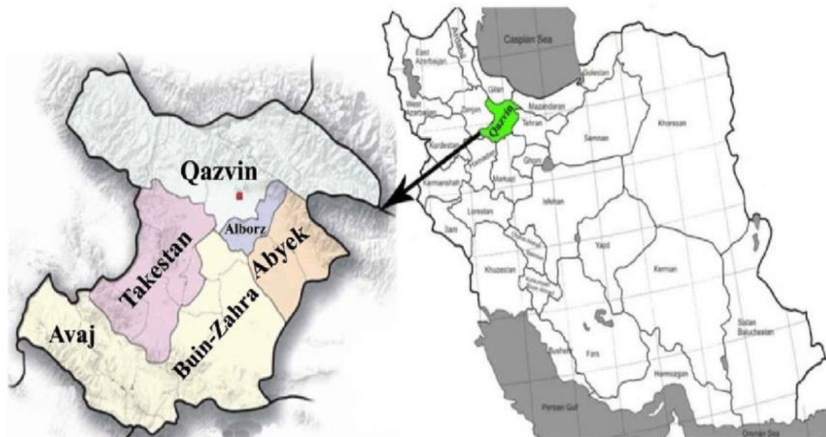
شکل ۱. منطقه‌ی جغرافیایی محدوده‌ی استان قزوین

منطقه‌ی مورد مطالعه و جمع‌آوری نمونه: مطالعه‌ی حاضر از نوع توصیفی می‌باشد، که بر روی آب شرب استان قزوین صورت گرفت. استان قزوین در بخش شمال غربی ایران واقع شده است، که نمونه‌گیری از شهر قزوین انجام شد (شکل ۱). جامعه‌ی مورد مطالعه در این پژوهش آب سرد و گرم لوله‌کشی شهری بود. آب لوله‌کشی سرد چهار نقطه شمال، جنوب، شرق و غرب شهر قزوین، به مقدار ۲۰ نمونه از هر منطقه و در مجموع ۸۰ نمونه آب سرد جمع‌آوری شد. آب لوله‌کشی گرم در هر منطقه ۱۰ نمونه و در مجموع ۴۰ نمونه از چهار منطقه‌ی جغرافیایی شهر قزوین جمع‌آوری شد. نمونه‌گیری از آب شرب به صورت تصادفی در بهار و تابستان ۱۴۰۰ انجام شد. نمونه‌برداری از آب قابل شرب لوله‌کشی و با استفاده از ظرف استریل