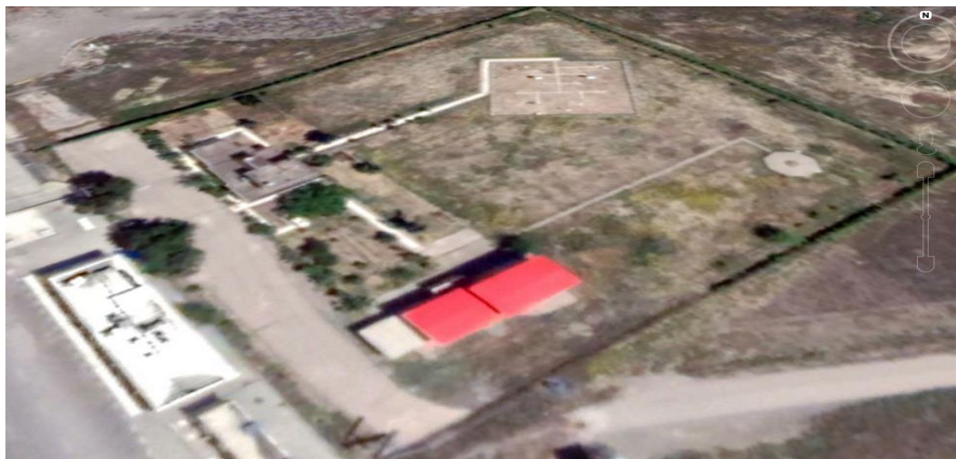
Fig. 1- Aerial image of the geographical location of Mashhad meteorological station