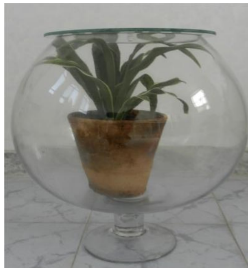
شکل ۱: نمایی از اتاقک

به منظور کمک به گردش هوا و نمونه‌برداری واقعی‌تر از هوای اتاقک، فن ۱۲ وات در مرکز اتاقک قرار داده و قبل از هر نمونه‌برداری به مدت نیم ساعت روشن می‌گردید (شکل ۱).