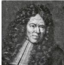
شکل ۱۱- برناردینو رامازینی

ورزش و تغییر وضعیت بدن و همچنین شست و شوی دست‌ها و صورت را پس از اتمام کار توصیه می‌کرد. او در برخی موارد در کارگرانی که مبتلا به مشکلات تنفسی می‌شدند، توصیه به تغییر شغل می‌کرد.