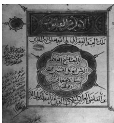
شکل ۷- تصویر صفحه اول نسخه اصلی کتاب قانون فی الطب

"علل فاعلی موجبات و عواملی است که تن آدمی را نگه می‌دارند و یا تغییر می‌دهند مانند هوا و متعلقات آن، غذاها، آب‌ها، آشامیدنی‌ها، تخلیه، احتقان، احتباس، محیط زیست، مسکن، فعالیت و استراحت، خواب، بیداری، تغییرات سنین عمر، جنسیت، پیشه، عادات، حرکات بدنی و چیزهای دیگری که با تن آدمی در تماس هستند و با طبیعت سازگار یا ناسازگارند.