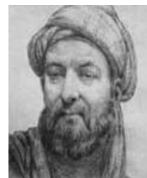
شکل ۶- حسین بن عبدالله مشهور به ابوعلی سینا

ابوعلی حسین بن عبدالله بن سینا، مشهور به ابوعلی سینا، ابن‌سینا و پورسینا پزشک و شاعر ایرانی و از مشهورترین و تاثیرگذارترین فیلسوفان و دانشمندان ایران است (شکل ۶) که به ویژه به دلیل آثارش در زمینه فلسفه ارسطویی و پزشکی اهمیت دارد. جرج سارتن در کتاب تاریخ علم، وی را یکی از بزرگترین اندیشمندان و دانشمندان پزشکی و همچنین مشهورترین دانشمند ایران می‌داند.