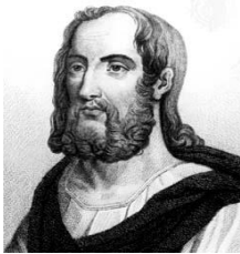
شکل ۳- تصویر منتسب به پلینی بزرگ

بدنه چاه عمیق می‌شود، دمه‌های گوگرد یا زاج به مقنیان می‌رسد و آنها را می‌کشد». او همچنین در مورد ماسک‌هایی که از مثانه حیوانات ساخته می‌شد و برای محافظت معدن‌کاران به کار می‌رفت نوشته است (۸).