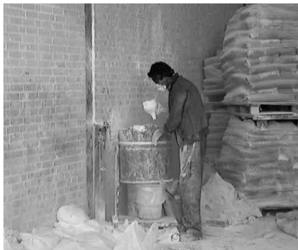
شکل ۱- وضعیت کارگر و محل قرار گیری او در محیط کار در هنگام انجام فرآیند توزین و بسته‌بندی مواد

در این مطالعه کاربرد آنالیز بیز برای داده‌های ارزیابی مواجهه مورد استفاده گرفت. داده‌های توزیع پیشین براساس قضاوت خبره کارشناسان با استفاده از مدل‌های SSA (Structured Subjective Assessment Method) (Material Estimated and Assessment of Substance Exposure) MEASE نیز تعیین گردید.