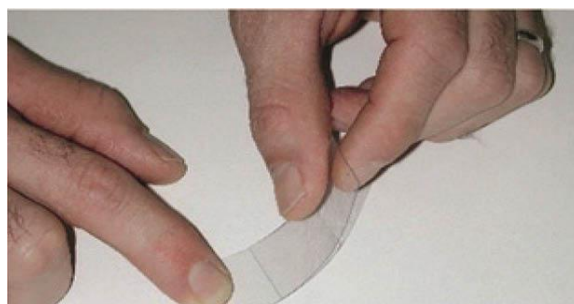
شکل ۲- نوارچسب حذف (۳۱)

Kammer و همکاران تکنیک نوار چسب حذف را برای اندازه‌گیری مواجهه پوستی با پایرن و بنزو آ پایرن مورد استفاده قرار دادند. آنها غلظت‌های معینی از بنزو آ