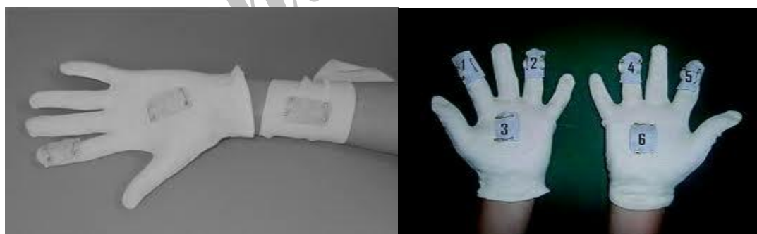
شکل ۴- نمونه‌برداری پیچ

هدف نمونه‌برداری پیچ تخمین مقدار موادی است که روی لباس، پوست و لایه‌های خارجی لباس جایگزین شده‌اند. نمونه‌برداری پیچ یک روش غیرفعال به حساب می‌آید قصد آن جمع‌آوری تمام مواد مورد نظر در طول دوره مواجهه است (شکل ۴). در پایان دوره نمونه‌برداری، وصله‌ها از روی لباس برداشته و در یک کیسه پلاستیکی یا شیشه‌ای بسته شده قرار می‌گیرد. نمونه می‌بایست تا انتقال به آزمایشگاه روی یخ نگهداری گردد (۴۶).