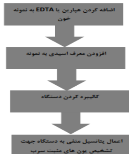
شکل ۳- مراحل آماده سازی نمونه جهت بررسی با روش ASV (۱۶)