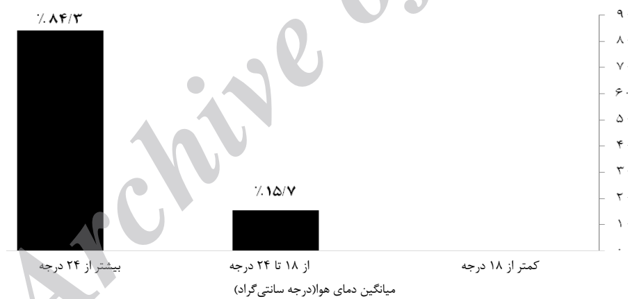
نمودار ۲: درصد فراوانی کلاس‌ها در هر محدوده دمایی