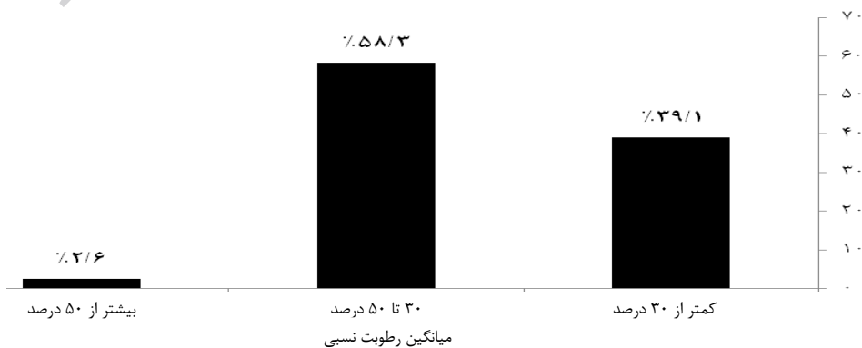
نمودار ۳: درصد فراوانی کلاس‌ها در هر محدوده از رطوبت نسبی