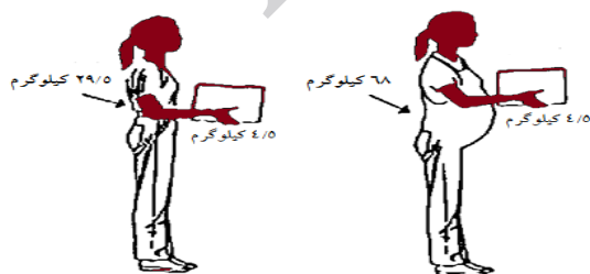
شکل ۲: فشار بیشتر بر ناحیه کمری در هنگام بلند کردن بار در حاملگی به علت فاصله بیشتر از بدن

برخلاف ایستادن و نشستن طولانی‌مدت که در حاملگی توصیه نمی‌شوند، راه رفتن باید توصیه و تشویق شود (۴۱). راه رفتن موجب بهبود گردش خون اندام تحتانی می‌شود و بدین ترتیب، احتمال واریس کم می‌گردد. در ضمن، هنگام بلند کردن بار سنگین به علت بزرگی شکم خانم حامله که منجر به نگره داشتن بار با فاصله بیشتری از بدن می‌شود، فشار بیشتری به کمر وارد می‌شود (۴۲) (شکل ۲).