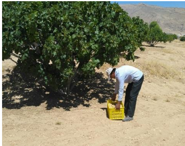
شکل ۲. کارگر در حال برداشتن سبد انجیر با پوسچر خمیده