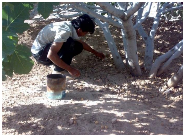
شکل ۱. کارگر در حال جمع‌آوری انجیر خشک زیر درخت

جهت ارزیابی خطر ابتلا به اختلالات اسکلتی عضلانی از روش PATH استفاده شد در روش PATH برای ارزیابی پوسچر تنه (۵ حالت)، گردن (۲ حالت)، پاها (۱۰ حالت)، دست‌ها (۳ حالت) و نیرو (۵ حالت) در نظر گرفته می-شود. کدهای استفاده شده برای هر یک از وضعیت‌های