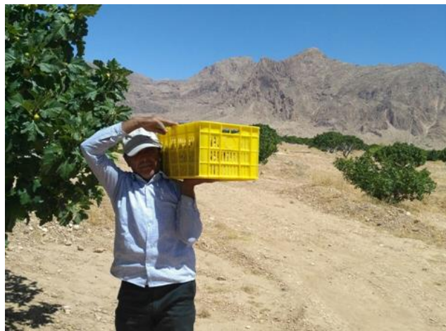
شکل ۳. کارگر در حین حمل ظرف به اسپنگ (جایگاه خشک کردن انجیر)