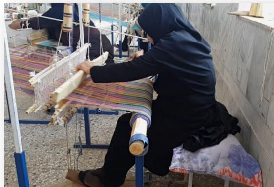
شکل ۱: ایستگاه کاری کاربافی

که در آن: n = تعداد وظایف دربردارنده ی حرکات تکراری اندام‌های فوقانی که در طی شیفت کاری انجام شده CF = ضریب ثابت تکرار فعالیت‌های تکنیکی در هر دقیقه، که بر اساس یک رفرنس بکار رفته است. Fa ، Fp و Ff = فاکتورهای ضریب، با رنج نمرات در محدوده ی بین ۰ و ۱؛ که براساس رفتار عوامل ریسک «نیرو» (Ff)، «وضعیت بدنی» (Fp) و «عناصر و اجزاء و