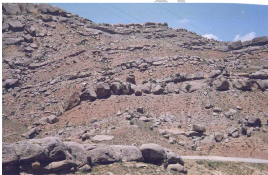
شکل ۴. نمایی از واحد مارنی مقاوم به فرسایش M_4^{SC} شامل تناوب مارن، ماسه‌سنگ و کنگلومرا

پس از تهیه‌ی نقشه‌ی مورد نظر، از اشکال مختلف فرسایش شامل شیاری، خندقی، هزاردره‌ای و توده‌ای سازند مارنی انتخاب شده ( M_2^{mg} ) نمونه گرفته شد. در مورد فرسایش‌های خندقی (در عمق ۲۰ تا ۳۰ سانتی‌متری از سطح زمین) و شیاری (در عمق ۵ تا ۱۵ سانتی‌متری از سطح زمین) از قسمت ابتدا، انتها و میانی آنها نمونه‌ای گرفته شد و یک نمونه‌ی مرکب از آن برای کاهش تعداد نمونه‌ها، تهیه شد. در مورد فرسایش‌های توده‌ای و هزاردره‌ای، سه نمونه از قسمت‌های مختلف سطح فرسایش یافته به‌صورت تصادفی تهیه و از آنها یک نمونه‌ی مخلوط‌شده همگن یا مرکب تهیه شد. از فرسایش‌های مختلف شیاری، خندقی، توده‌ای و