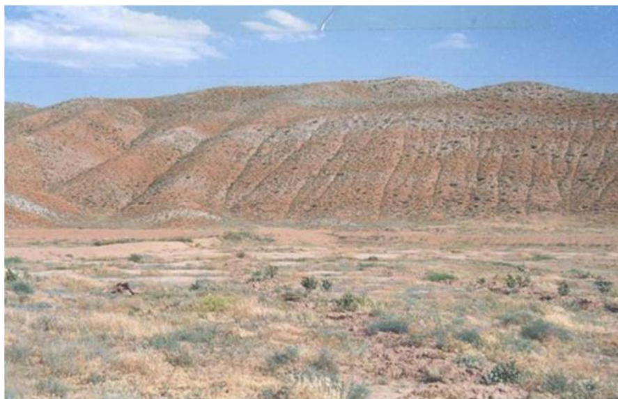
شکل ۳. نمایی از واحد M_2^{mg} شامل مارن‌های گچی - نمکی به‌عنوان حساس‌ترین واحد مارنی منطقه