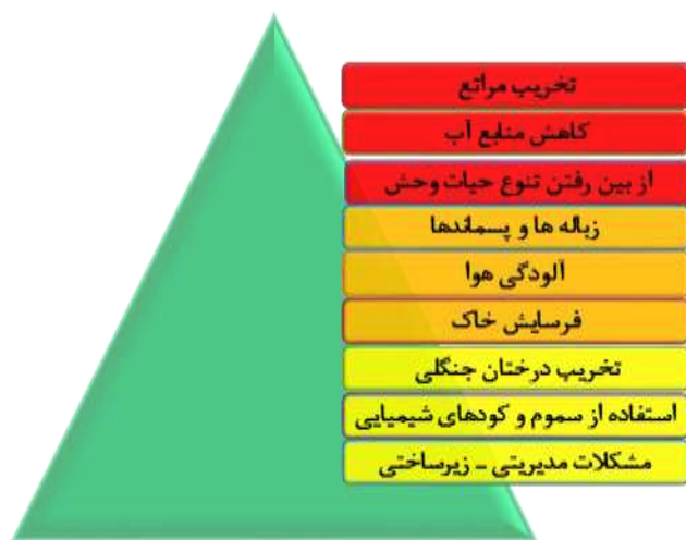
شکل ۲. شناسایی مهم‌ترین چالش‌های زیست‌محیطی روستای بدرآباد

در این زمینه، روستاییان می‌گویند «اغلب روستاییانی که دام ندارند در فصل بهار با گرفتن وام‌های کلان و یا از طریق شراکت با سرمایه‌داران حدود ۳ تا ۴ هزار گوسفند و بز را خریداری کرده و بعد از اتمام کامل مراتع قابل دسترس و مراتع کوه شاهو که در دسترس دام‌های روستاییان برای استفاده روزمره نیست، گله‌ها را می‌فروشند.» همچنین، روستاییان اظهار کرده‌اند که «در طرح کشت باغات مراتع را طوری استفاده کرده‌اند که راه را برای استفاده از مراتعی که در پشت باغات هستند کاملاً مسدود کرده است و همچنین، با زیر کشت بردن مراتع، شرایط لازم را برای تغذیه دام‌ها به‌ویژه دام‌های سنگین در دامنه‌ها بسیار دشوار کرده است.» بر اساس یافته‌های به دست آمده، کاهش منابع آب دومین چالش زیست‌محیطی روستای بدرآباد است که عوامل متعددی در آن دخیل هستند. از جمله این عوامل می‌توان به کاهش میزان نزولات جوی به‌ویژه بارش برف در سطح روستا و منطقه طی چند سال اخیر، استفاده بی‌رویه از منابع آب زیرزمینی که اغلب به شیوه آبیاری سنتی هستند و احداث چاه‌های متعدد دستی، نیمه‌عمیق و عمیق و استفاده نکردن از سیستم‌های آبیاری تحت فشار اشاره کرد. لازم به ذکر است فقط در روستای بدرآباد بیش از ۸۰ حلقه چاه دستی و نیمه‌عمیق و ۱۲ حلقه چاه عمیق حفر شده است که اغلب آنها به شدت کم‌آب بوده و یا خشک شده‌اند. در این رابطه، یکی از روستاییان چنین عنوان کرده است که «از وقتی که استفاده از آب‌های زیرزمینی برای تولید محصولات زراعی در روستا شروع شده است اول چشمه‌ها، سپس سد روستا و در حال حاضر چاه‌های دستی به شدت با کم‌آبی مواجه شده و یا خشک شده‌اند.»