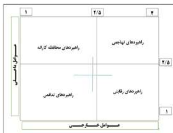
شکل ۲. نمودار ارزیابی عوامل داخلی و خارجی

در فاز دوم پژوهش، به منظور امکان‌سنجی اجرای راهبردهای شناسایی شده، ۱۱ راهبرد شناسایی شده تدافعی، بر اساس شش شاخص شامل منابع مالی، قوانین و مقررات، مدیریتی، مشارکت متقاضیان، مشارکت عرضه‌کنندگان و فنی و تکنولوژی با کمک ۳۰ نفر از کارشناسان و با استفاده از نرم‌افزار ویزوال پرامیتی ۱ بررسی و اولویت آنها مشخص شد. با توجه به سنخیت معیارها، نوع تابع ترجیحی در این خصوص، تابع نوع سوم و با مقدار p = 2 است، یعنی در مقایسات زوجی، اگر تفاوت بین دو راهبرد بیشتر از ۳ (در بازه ۱ تا ۱۰) باشد گزینه‌ای که امتیاز بیشتری دارد دارای اولویت کامل است. بر اساس نتایج تحقیق به اعتقاد کارشناسان مهم‌ترین شاخص برای امکان‌سنجی اجرای راهبردها تأمین منابع مالی و عامل مدیریتی با ضریب اهمیت ۲۶ و ۲۱٪ است (جدول ۶).