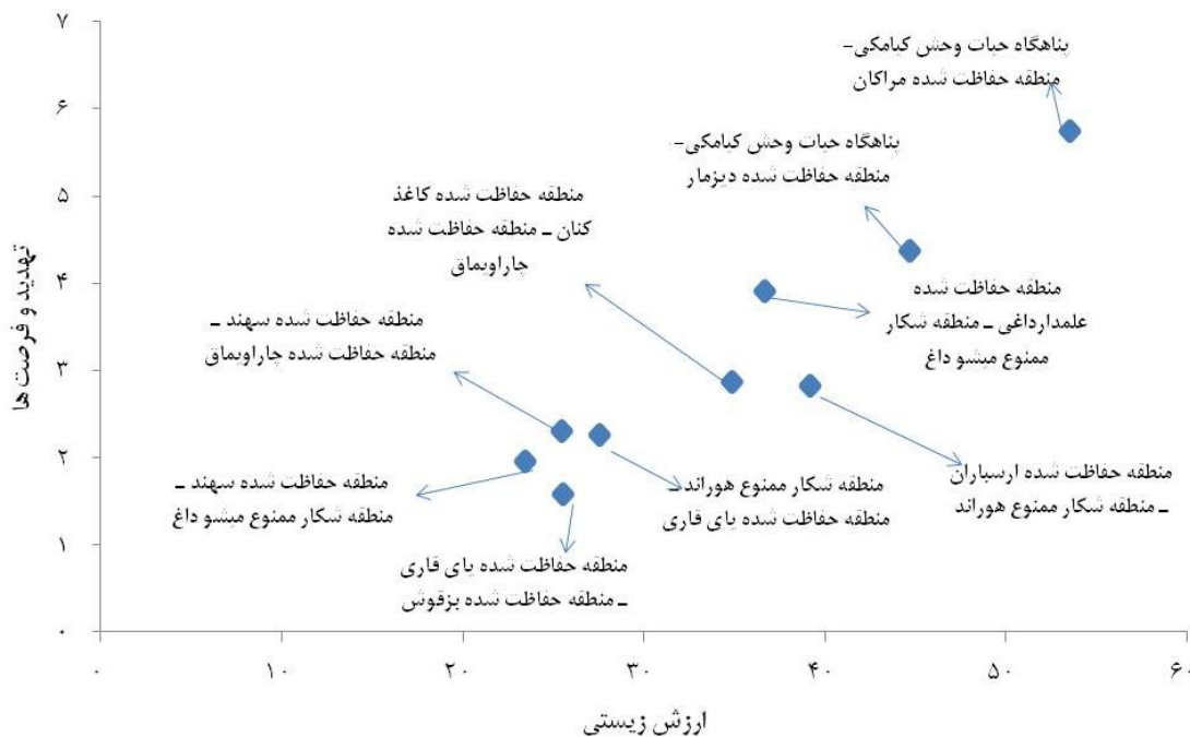
شکل ۲. اولویت‌بندی طراحی کریدور در بین مناطق حفاظت‌شده استان آذربایجان شرقی بر اساس معیارهای تنوع زیستی و تهدید - فرصت‌ها

مشاهدات میدانی، نقاط ثبت‌شده محل حضور گونه‌ها هنگام عبور از جاده‌های مرند - جلفا و ایواغلی - جلفا و نظرات کارشناسان و محیط‌بانان اداره کل حفاظت محیط‌زیست آذربایجان شرقی تأییدکننده صحت محل قرارگیری کریدورهای مشخص‌شده در این مطالعه برای گونه‌های شاخص انتخابی است (شکل ۳).