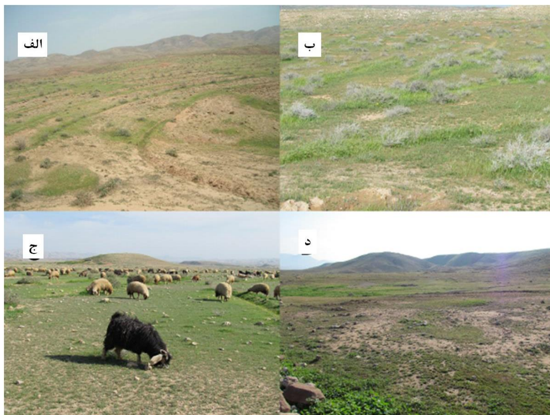
شکل ۲. الف: وضعیت تیمار عملیات فارو همراه با بوته کاری؛ ب: تیمار عملیات پیتینگ همراه با بوته کاری؛ ج: وضعیت پوشش گیاهی مرتع تحت سیستم چرایبی تناوبی - استراحتی؛ د: مرتع شاهد با بهره برداری متداول منطقه