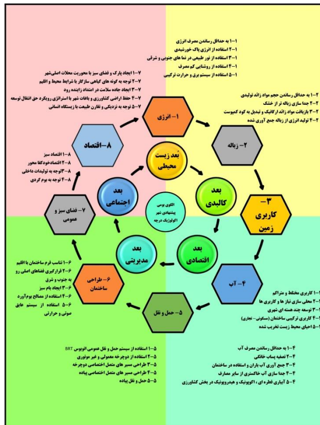
شکل ۳. الگوی پیشنهادی شهر اکولوژیک درچه بر مبنای نتایج دیدگاه خبرگان

براین اساس الگوی بومی پیشنهادی شهر اکولوژیک درچه با اولویت شاخص‌های این دو بعد در قالب ۸ شاخص اصلی طراحی شد (شکل ۳) و درعین حال باتوجه به دیدگاه فضایی علم جغرافیا شاخص‌های دیگر ابعاد نیز موردتوجه قرار گرفت. در الگوی بومی پیشنهادی بر اساس نظر خبرگان شاخص‌های زیست‌محیطی اولویت اول پیشنهادهای را به خود اختصاص می‌دهد که شامل استفاده بهینه از انرژی‌های تجدیدپذیر و کم‌مصرف، به حداقل رساندن حجم زباله و بازیافت، استفاده بهینه از آب و تصفیه آن، توجه ویژه به فضای سبز و کشاورزی شهری است. در بحث شاخص‌های اقتصادی نیز توجه به اقتصاد سبز و خودکفا محور و تقویت تولیدات داخلی و توجه به بوم‌گردی باتوجه به نزدیکی به شهر اصفهان موردتوجه است؛ ضمن اینکه توجه به حمل‌ونقل و طراحی ساختمان اکولوژیک و کاربری مختلط و متراکم نیز از جهت بعد کالبدی در الگوی پیشنهادی جایگاه ویژه‌ای به خود اختصاص داده است.