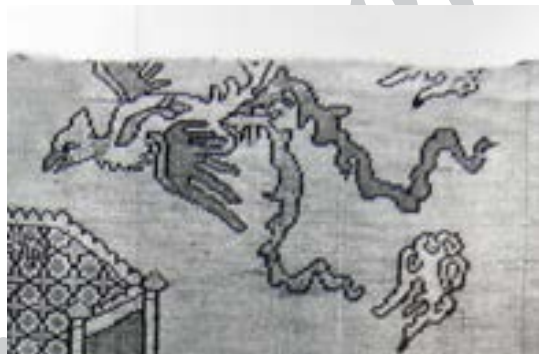
تصویر ۱۰- نقش سیمرغ در منسوجات صفوی (پوپ و اکرم، ۱۳۸۷)

دم سیمرغ ساسانی در (تصویر ۹) مانند حجمی اشباع شده از نقوش هندسی ترسیم و از پایین به طرف بالا حجیم تر می شود و نیم دایره ای را تشکیل می دهد. سطح دم بوسیله ی فرم های هندسی پوشیده و تزئین شده است. از نمای جانبی ترسیم شده و رسم آن تمایل به تطبیق با کادر دایره دارد. سیمرغ در منسوجات صفوی تقریباً با اوصافی که از آن در منابع ادبی و اساطیری رفته مطابقت دارد. پرنده ای بزرگ با بال ها و دم های متعدد و بلند و پیچان و دهان منقار گونه از مشخصات آن است و به فیزیک واقعی پرنده گان شباهت بیشتری دارد.