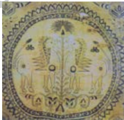
تصویر ۷- نقش درخت زندگی ( نخل ) با شیران محافظ در منسوجات ساسانی، سده ۸ - ۹ م ( ریاضی، ۱۳۸۲)

نقش درخت در این نوع ترکیب بندی بر اساس نقش جانوران و سایر عناصر تغییر می کند. گاهی درخت با شاخ و برگ گسترده و در برخی موارد کاملاً منسجم، ساده و هندسی دیده می شود.