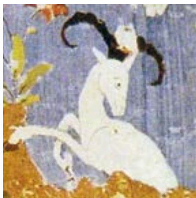
تصویر ۲۲- نقش قوچ در منسوجات صفوی، کرمان، نیمه سده ۱۰ ه ق، مجموعه ی خانم دبلیو. اچ. مور، (پوپ و اکرم، ۱۳۸۷)