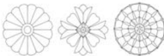
تصویر ۵_ نقش گل های پُرپر در منسوجات ساسانی بر اساس حجاری های طاق بستان (ریاضی، ۱۳۸۲)

می توان گفت که گل های قلبی شکل در اصل گل رز و گل چهار پر بوده اند که اغلب در شرق یافت می شوند. گل پُرپر با نام های رزت و گل سرخ نیز شناخته می شود و در دوره ساسانی نماد سنتی خورشید و بازگو کننده ی نیروی زندگی بخشی است. (موسوی و آیت اللهی، ۱۳۹۰: ۵۴) این گل در فرهنگ تصویری ما دارای جایگاه دیرینه ای است. بر روی مفرغینه های لرستان، جام طلایی مارلیک و کتیبه های تخت جمشید و ... این گل را به صورت مکرر و به شکل حاشیه مشاهده می کنیم. (عزیزی و نوائی، ۱۳۸۷: ۸۵)