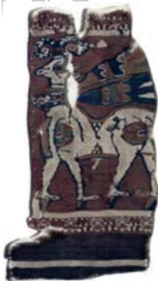
تصویر ۲۱- نقش قوچ در منسوجات ساسانی، ۷-۸ میلادی، موزه متروپولیتن ( www.cais-soas.com )

قوچ به برخی از نژادهای گوسفند نر که دارای شاخ مورب و حلقوی و پیچ دار می باشند گفته می شود. گوسفند در اصل « گوسپنت» ( گاو مقدس) بوده است و گاو علاوه بر معنی معمول، به صورت اسم جنس به همه چهارپایان مفید اطلاق می شود. (یاحقی، ۱۳۸۸: ۶۸۹) گوسفند پنجمین آفریده ای مادی اهورامزدا بود که در هفتاد و پنج روز خلق شد. (بهار، ۱۳۷۸: ۳۷) قوچ نماد قوه ی مردانگی، انرژی آفریننده، نیروی محافظ و در سال شمسی نماد منطقه البروج و آغاز بهار است. (کوپر، ۱۳۷۹: ۲۸۲) همچنین قوچ مظهر خورنه، فره و نشان قدرت شاهی و نماد پیروزی است. (موسوی و آیت اللهی، ۱۳۸۹: ۵۳) در اساطیر ایرانی گوسپند تک شاخی به نام کورشک در داستان نوزادی زرتشت مأمور شیردهی به زرتشت نوزاد بوده است. بدین صورت که وقتی وی را به لانه ی گرگی می اندازند، این گوسپند به او شیر می دهد. در داستان آفرینش هم گوسپند حضور دارد. زمانی که مشی و مشیانه نا فرمانی کرده و از شیر بز سپیدی می نوشند و گوشت گوسپندی تیره و سپید آرواره را می خورند، در خود نزول مقام را مشاهده می کنند. (بهار، ۱۳۷۸: ۱۷۷) از این نقش روی پارچه های ساسانی برای نشان دادن صحنه های دلآوری و پیروزی و هم چنین برای نشان فر شاهی و بزرگی شاه استفاده شده است.