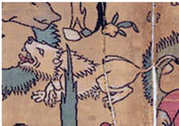
تصویر ۱۸- نقش شیر در منسوجات صفوی

نسبت دادن و نقش برخی از ائمه با شیر بهترین و مناسب ترین موقعیت را برای زنده کردن این سنت نقش پردازي در دوره ی اسلامی به وجود آورد و شیر به عنوان مظهر قدرت و شجاعت باقی ماند. نقش شیر از سفال های سیلک در فرهنگ ایرانی موجود است تا نقش حمله شیر به گاو که در نقش تخت جمشید کنده شده است. این نقش همواره در هنر ایرانی پیش از دوران اسلامی وجود داشته است.