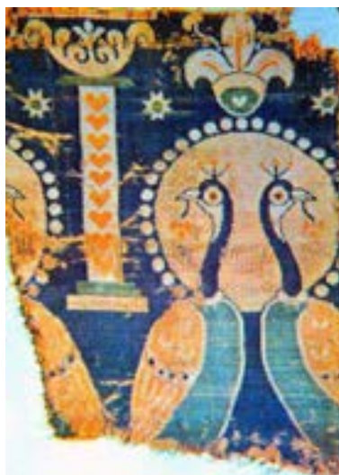
تصویر ۱۳- نقش طاووس در منسوجات ساسانی