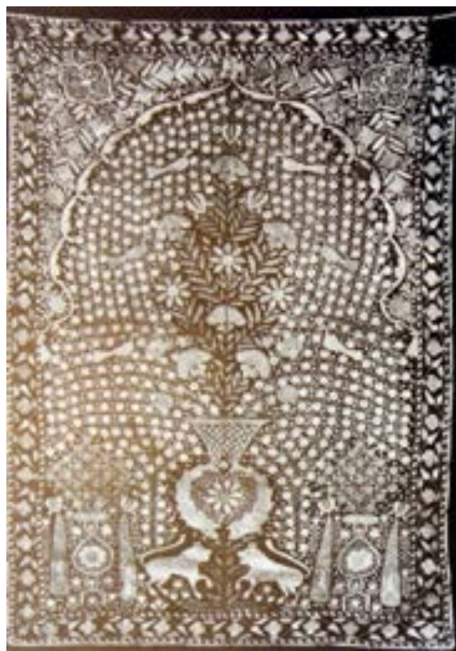
تصویر ۸- طرح محرابی و درخت زندگی در منسوجات صفوی، سده ۱۷ م (پوپ و اکرم، ۱۳۸۷)

(تصویر ۸) این طرح از طرفی مفهوم محراب، جای عبادت، تقرب خدا و از جایی دیگر مفهوم محراب به معنای جای قرب یعنی « جنگ در راه خدا» را به ذهن متبادر می کند. (تنهایی و خزائی، ۱۳۸۸: ۷) در این مکان مقدس اغلب درخت زندگی با یک گلدان گل همراه با حوضچه ی آب قرار دارد که اشاره ای به آب حیات دارد. در این طرح ها معمولا گیاهی شبیه سرو در مرکز محراب قرار دارد. این درخت از دیر باز علامت خاص ایرانیان بوده است. بنابر روایات ایرانی زرتشت این درخت را در کنار درخت انار و انگور مقدس می شمارد.