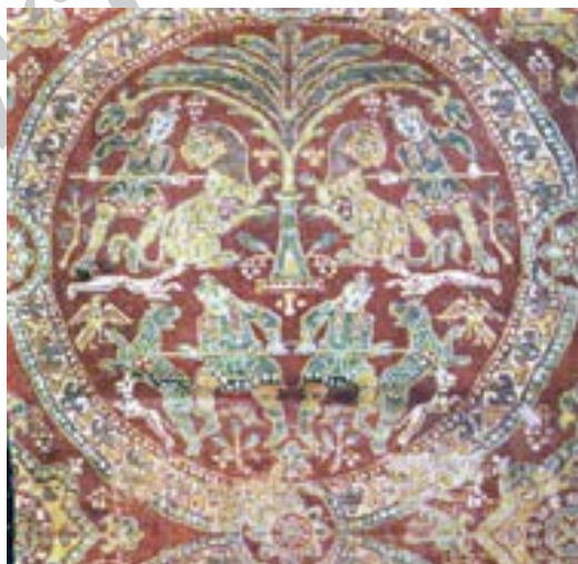
تصویر ۱۷- نقش شیر در منسوجات ساسانی

بسیاری از شاهان ایرانی به خصوص پادشاهان ساسانی شکار را جزو تفریحات سلطنتی می‌دانستند و در دوره‌ی ساسانی شکار شیر و مبارزه با آن به عنوان یکی از مظاهر قدرت و زورمندی پادشاهان محسوب می‌شده است. بنابراین قرار گرفتن نقش شیر به صورت نقشی رایج بر آثار هنری ایران موضوعی دور از ذهن و عجیب تلقی نمی‌شود.