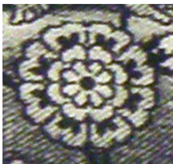
تصویر ۴_ نقش گل با گلبرگ های قلبی شکل در منسوجات صفوی، اوایل سده ۱۷ م (پوپ و اکرمین، ۱۳۸۷)

می توان گفت که گل های قلبی شکل در اصل گل رز و گل چهار پر بوده اند که اغلب در شرق یافت می شوند. گل پُرپر با نام های رزت و گل سرخ نیز شناخته می شود و در دوره ساسانی نماد سنتی خورشید و بازگو کننده ی نیروی زندگی بخشی است. (موسوی و آیت اللهی، ۱۳۹۰: ۵۴) این گل در فرهنگ تصویری ما دارای جایگاه دیرینه ای است. بر روی مفرغینه های لرستان، جام طلایی مارلیک و کتیبه های تخت جمشید و ... این گل را به صورت مکرر و به شکل حاشیه مشاهده می کنیم. (عزیزی و نوائی، ۱۳۸۷: ۸۵)