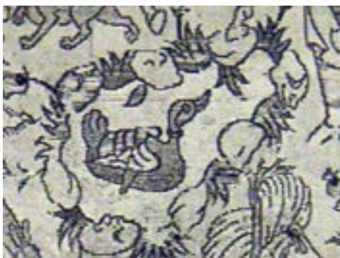
تصویر ۱۶- نقش مرغابی در منسوجات صفوی (پوپ و اکرم، ۱۳۸۷)