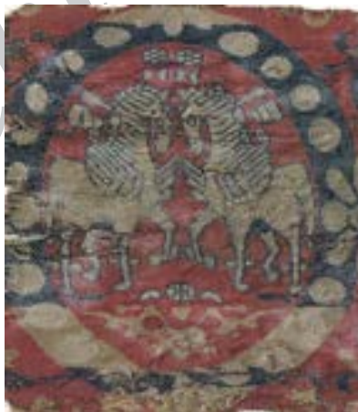
تصویر ۱۹- نقش اسب در منسوجات ساسانی، ۶-۸ م

اسب از روزگار کهن در اساطیر ملل مورد توجه بوده و به نگرهبانی و تیمار این حیوان سودمند که به صفات تند و تیز و چالاک و دلیر و پهلوان موصوف است اهتمام داشته اند. فرشته ی نگرهبان چهارپایان دراوستا، درواسپا (دارنده ی اسب سالم) خوانده شده است. شاید با توجه به همین مسئله است که اسب را شاه چرندگان و در میان چهارپایان از همه نیکوتر دانسته و از قول کیخسرو نقل کرده اند: هیچ چیز در پادشاهی بر من گرامی تر از اسب نیست. (یاحقی، ۱۳۸۸: ۱۱۱) اسب در متون اوستایی در کنار گاو و گوسفند از جمله جانورانی است که برای ایزدان و امشاسپندان قربانی می شود. بنا به روایات ایرانی بسیاری از پادشاهان اساطیری ایران برای ناهید الهه آب ها اسب قربانی می کردند. (بهار، ۱۳۷۸: ۲۴۹)