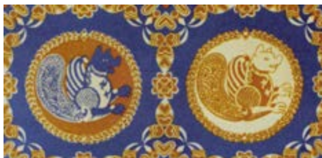
تصویر ۹- بازسازی نقش سیمرغ در منسوجات ساسانی (ریاضی، ۱۳۸۲)

سیمرغ بنا بر روایات کهن بر بالای درخت شگفت آور همه تخم که در میان دریای فراخکوت است آشیان دارد. سیمرغ در شاهنامه و اوستا و روایات پهلوی، موجودی خارق العاده و شگفت است. پره‌های گسترده اش به ابر فراخی می ماند و در پرواز خود پهنای کوه را فرا می گیرد. منقارش چون منقار عقاب و صورتش چون صورت آدمیان است. فیل را به آسانی می رباید و از این رو به پادشاه مرغان شهرت یافته است. هزار هفتصد سال عمر دارد و در هر سیصد سال تخم می نهد و بعد از ۲۵ سال جوجه از تخم بیرون می آید. (یاحقی، ۱۳۸۸: ۵۰۳) سیمرغ ساسانی در واقع یک موجود افسانه ای ترکیب شده از چند گونه ی حیوانی است که شامل بدن و سر سگ، پنجه های شیر و دم طاووس می شود. (تصویر ۹) بدن و سر سگ و شیر (یا در برخی موارد دیگر چهارپایان) نماد زمین، بال های پرنده نماد آسمان و پولک و فلس های ماهی پوشش بدن نماد آب می باشد (طاهری، ۱۳۸۸: ۱۸)