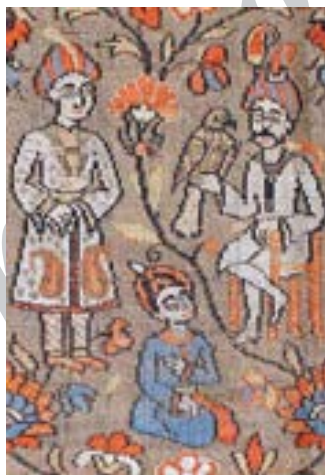
تصویر ۱۲- نقش عقاب در منسوجات صفوی، حدود ۱۷ م

در (تصویر ۱۲) تصویر یک قوش باز در پارچه ی صفوی نشان داده شده است. قوشبازی هنر پرورش و نگهداری پرندگان شکاری است به گونه ای که به واسطه دست آموز کردن این پرندگان، می توان از آنها به عنوان ابزاری برای شکار استفاده کرد. در ایران سلاطین صفویه بیش از سایرین به این حرفه علاقه نشان می دادند.