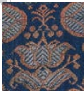
تصویر ۲_ نقش گل از پهلوی در منسوجات صفوی، حدود ۱۷۰۰ میلادی

نیلوفر به اشکال مختلفی ترسیم می شود. در تصویر مربوط به منسوجات ساسانی ( تصویر ۱) گل از نمای پهلوی و به صورت متقارن و با ساقه ای به عنوان محور مرکزی دیده می شود. برگ های آن در زیر گلی بزرگ به دو طرف گسترده شده و گلبرگ های داخلی آنها بین دو گلبرگ خارجی قرار گرفته اند. این نوع گل با ویژگی های بیان شده در منسوجات صفوی کاربرد فراوانی دارد. ویژگی های ریختی این گل (نیلوفر) همچنین به مقدار زیادی گل معروف به شاه عباسی را در ذهن تداعی می کند. که در زمان حکومت صفویان و در زمان اقتدار شاه عباس کبیر به این نام معروف شد.