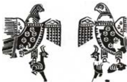
تصویر ۱۱- نقش عقاب در منسوجات ساسانی (ریاضی، ۱۳۸۲)

عقاب نماد همه ی ایزدان آسمان، خورشید، رهایی از بند، پیروزی، سلطنت، قدرت و اقتدار است. (کوپر، ۱۳۷۹: ۲۲۱) در دوران هخامنشی عقاب از جایگاه والایی برخوردار بوده است. در هنر پارسی و ساسانی به عنوان نماد ایزد آفتاب (میترا) مطرح بوده است و در برخی از اساطیر هند و ایرانی رب النوع توفان در قالب عقاب ظاهر می گردد. (بهار، ۱۳۷۸: ۴۷۹) فر کیانی در اوستا به صورت مرغی به نام وارغن (vereghan) نشان داده شده که از تیره ی عقاب، شاهین یا باز است. بدین ترتیب پادشاهان هخامنشی با به کار گیری این نماد در بیرق و پرچم هایشان فرکیانی را به خود اختصاص داده و خود را مظهر خداوند در روی زمین معرفی می کرده اند. در اساطیر ایرانی کسی که استخوان یا پر این مرغ را با خود داشته باشد هیچ مرد توانایی او را نتواند کشت و از جای به در نتوان کرد. (یاحقی، ۱۳۸۸: ۸۴۷) در (تصویر ۱۱) عقاب در پارچه ی ساسانی در حال حمله به بز کوهی نشان داده شده است. فراتر از مرزهای ایران در سومر، عقاب در حال حمله بر بز کوهی نقش شده است.