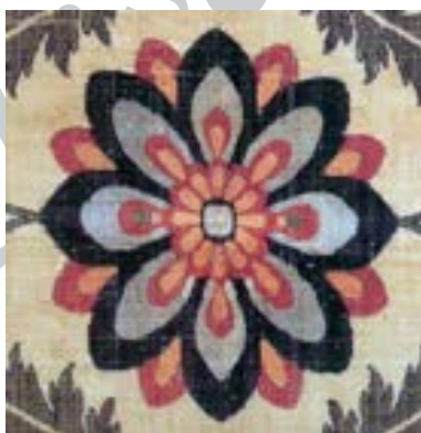
تصویر ۶_ نقش گل پُرپر در منسوجات صفوی (کنبای، ۱۳۸۱)

در منسوجات صفوی نقوش به صورت دسته گل هم دیده می شود که در بعضی حالات به طور کامل به طبیعت گرای گرایش دارد.