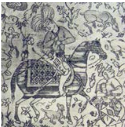
تصویر ۲۰- نقش اسب در منسوجات صفوی، مجموعه ی لی لی بی. بلیس (پوپ و اکرمین، ۱۳۸۷)

فرم قرار گیری پاهای اسب در این دو نمونه جالب توجه است به صورتی که هر دو پاهای پشت به تصویر در حالت بلند شده از زمین قرار دارند. در نقش اسب در دیگر نمونه های منسوجات صفوی نیز که اسب در حال قدم زدن است همین فرم پاها مشاهده می شود.