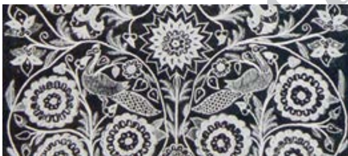
تصویر ۱۴- نقش طاووس در منسوجات صفوی ( پوپ و اکرم، ۱۳۸۷ )

طاووس در دوره ی اسلامی از سلسله ی صفویه در تزئینات مساجد و اماکن مذهبی در کنار درخت زندگی حضوری پر رنگ دارد. (خزائی، ۱۳۸۶: ۲۶)