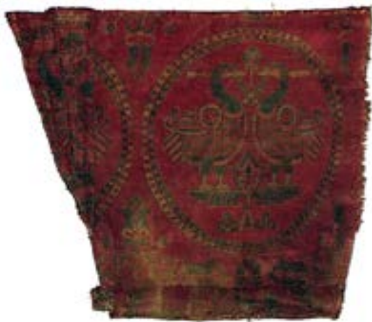
تصویر ۱۵- نقش مرغابی در منسوجات ساسانی

در باور ایرانیان هر پرنده ای که در ارتباط با آب باشد نمادی از آناهیتا یا ناهید است. (نیبرگ، ۱۳۵۹: ۴۱) آناهیتا الهه آب ها مورد ستایش همه ایزدان است چرا که از او موجب فرخی و باروری جهان و جانوران است. (بنونیست، ۱۳۸۳: ۳۹)