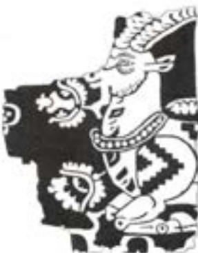
تصویر ۲۳- نقش بز در منسوجات ساسانی، ۶- ۸ میلادی (ریاضی، ۱۳۸۲)

بز کوهی حیوان ملی ایران دانسته شده است. (دادور و منصور، ۱۳۸۵: ۹۱) نقش آن از قدیمی ترین سفالینه های شوش و سیلک تا مفرغ های لرستان و آثار دوران ایلام و هخامنشی و پارتی و ساسانی مورد توجه بوده است. بز کوهی با شاخ های بزرگتر از حد معمول و درست شبیه هلال ماه بر سفالینه ها ترسیم شده است. گاهی شاخ او نماد ماه است. در اکثر پدیده های هنری، آناهیتا (الهه ی آب) در قالب بز کوهی مجسم شده است. بز نماد نیروی زندگی، خالق نیرو و نگهبان درخت زندگی می باشد. همچنین نماد فراوانی محصول و مظهر زندگی و نباتات بوده است. در هنر لرستان بز کوهی را نماد حیوانی خورشید می دانستند. (پورخالقی، ۱۳۸۱: ۲۸۱) پس از فرمانروایی خورشید بز کوهی حیوان خورشید نام گرفت. (دادور و منصور، ۱۳۸۵: ۹۱)