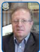
محمد رضا قادری مدیرکل نجات و حفاظت دریایی سازمان بنادر و دریانوردی