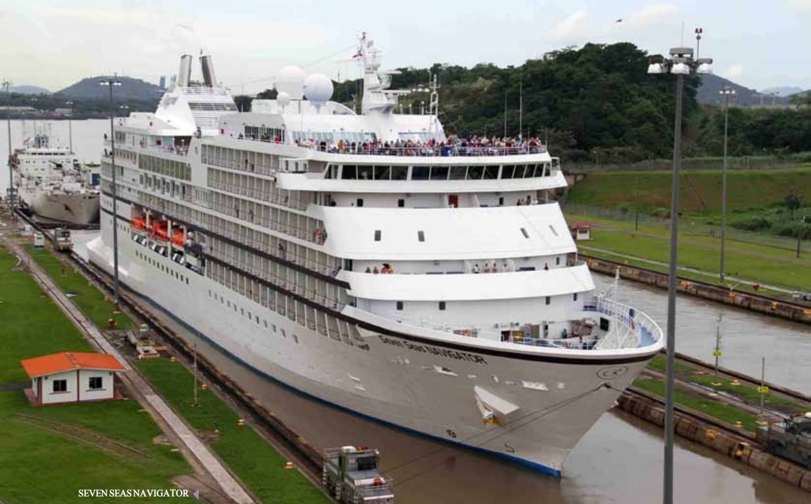
SEVEN SEAS NAVIGATOR