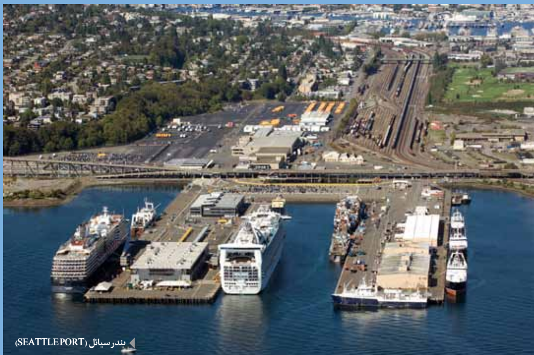
بندر سیاتل (SEATTLE PORT)

اساساً وقتی طرفین گفت‌وگو درباره یک مساله، بر محدوده معنای یک لفظ محوری و مرزها و حدود آن اتفاق نظر نداشته باشند، معانی به درستی منتقل نمی‌شوند و به همین دلیل، هر یک از طرفین ماجرا در اثر سهل‌انگاری و ضعف اندیشه، به همان تصور مبهم و مشوشی که در ذهن خود دارد، قناعت ورزیده و پایه‌های تفکر خود را بر چنین تصوراتی بنا می‌سازد. در این میان گردشگری دریایی یکی از مسایلی است که به گفته منتقدان عدم استفاده از تمام پتانسیل‌های آن، متاثر از بی‌هدفی همچون کشتی بی‌ناخدایی می‌ماند که در دریای متلاطم قوانین دست‌وپاگیر بی‌هدف در حرکت است؛ تلاطمی که خطرات ناشی از سلاطین مدیران و جبر طبیعت در کمین این کشتی است، لذا نگارنده این تحلیل با ذکر عنوان مشروط «اگر گردشگری دریایی تعریف شود؟»، کوشیده به اتفاق‌های خوب سیزده‌گانه تعریف گردشگری دریایی اشاره کند.