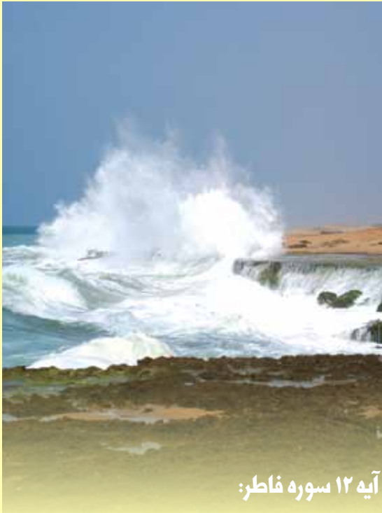
آیه ۱۲ سوره فاطر:

«وَتَرَى الْفُلْكَ فِيهِ مَوَاجِرَ لَتَبْتَغُوا مِنْ فَضْلِهِ وَ لَعَلَّكُمْ تَشْكُرُونَ»