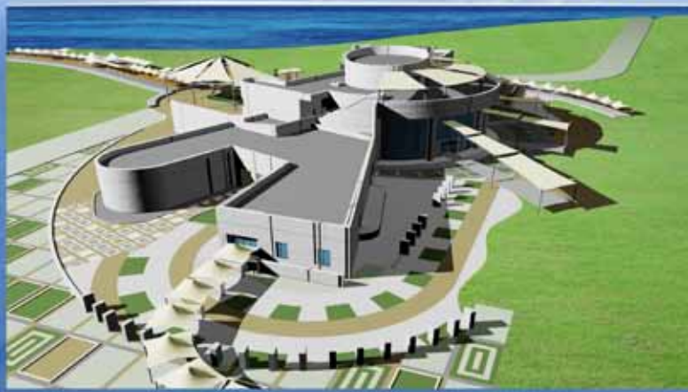
تصاویر سه بعدی طرح ترمینال مسافری شهید حقانی