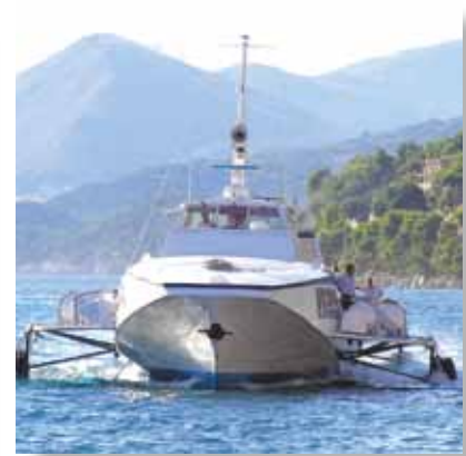
کشتی های هیدروفویل (Hydrofoil)