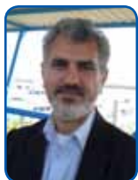
قاسم عسگری نسب معاون دریایی و بندری شهید باهنر