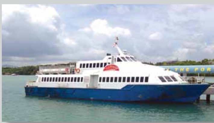
کشتی های فری (Ferry)