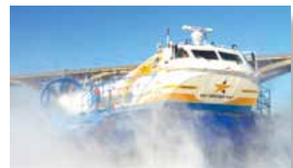
هاورکرافت ها (Hovercraft)

هاورکرافت ها به دلیل سرعت بالا و مانور مناسب در شناورهای تجسس و نجات و همچنین مسیرهای کوتاه مورد استفاده قرار می گیرند. از معایب این شناورها می توان به سرو صدای زیاد و باربری کم آنها اشاره کرد.