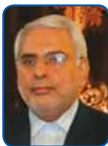
محمد جواد محمدی زاده معاون رئیس جمهور و رئیس سازمان حفاظت محیط زیست