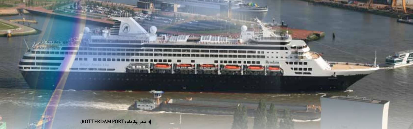
◀ بندر روتردام (ROTTERDAM PORT)