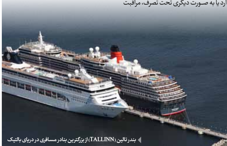
بندر تالین (TALLINN) از بزرگترین بندر مسافری دریای بالتیک

حمل بین‌المللی، به معنای هر گونه حملی است که در آن بنا به قرارداد حمل، مبدأ و مقصد حمل در ۲ کشور مختلف باشد یا در یک کشور واحد قرار داشته باشد؛ مشروط بر اینکه طبق قرارداد حمل